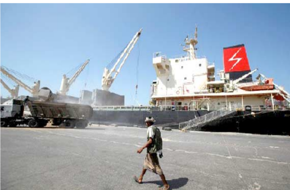
محاصر: يمني في مرفا الحديدية المحاصر

شخص واصابة 53 الفا على الاقل، ووضع البلاد التي يبلغ عدد سكانها نحو 27 مليون نسمة على حافة المجاعة. وكان مجلس الامن الدولي التابع للأمم المتحدة ندد في وقت سابق من الشهر الحالي بالتحصن المتواصل للوضع الانساني في اليمن، محذرا من الاثر "الدمر" لهذا التحصن على حياة السكان، حيث ان هناك اكثر من 20 مليون شخص بحاجة لمساعدة انسانية عاجلة. وتشكل حركة الدخول الى ميناء الحديدية عاملا اساسيا في التعامل مع هذه الازمة كون الريف يمثل نقطة العبور الرئيسية للمساعدات الى المناطق الخاضعة لسلطة المتمردين الحوثيين، وبينها العاصمة صنعاء. ويحكم التحالف بحركة الدخول والخروج من الميناء وبكافة المنافذ البحرية والجوية والبحرية الاخرى في المين. وعيد اطلاق الحوثيين لصاروخ بالستي