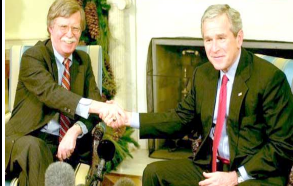
مصافحة: بولتون يصافح بوش الابن الابن الرئاسة الأمريكية

بشان كوريا الشمالية، لا يجب الانتظار حتى الحقيقة الأخيرة" واضاف "انه امر مشرور للولايات المتحدة ان تدار بالهجوم ردا على تهديد السلاح النووي من قبل كوريا الشمالية". واقادت تقارير بان ترامب تخلص من وزير خارجيته السابق، ريكس تيلرسون، بسبب تعارض وجهات نظرها بشأن البرنامج النووي الإيراني، الذي ينتقده الرئيس الأمريكي بشدة. وفي حالة بولتون فإن الامر يختلف ذلك انه يتفق مع ترامب في رأيه. فقد انتقد بولتون إدارة الرئيس السابق باراك اوباما لموافقته على الاتفاق النووي مع إيران في عام 2015. وقد كتب في العام الماضي يقول ان نص الاتفاقية "خلق ثغرات كبرى، وإيران تطور الآن صواريخها وبرنامجهما النووي من خلال تلك الثغرات".