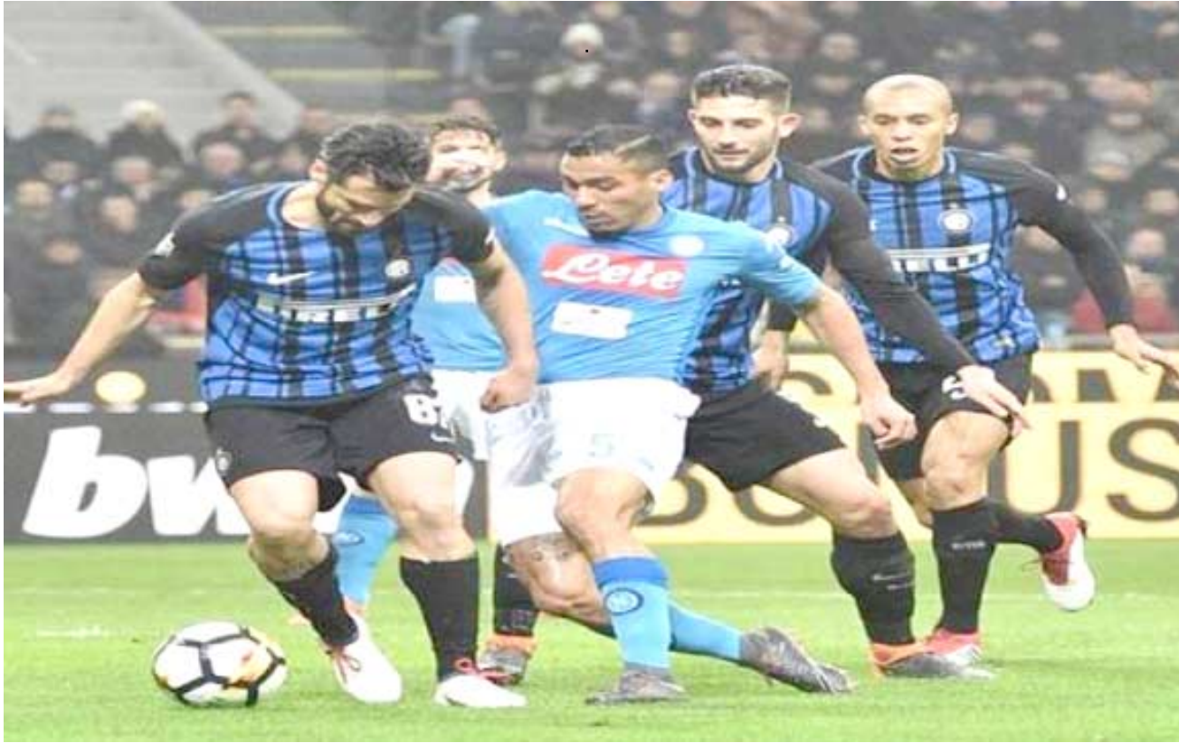
تعاقد، نجح إنتر ميلان في فرض التعادل على نابولي في قمة مباريات الدوري الإيطالي

تغلغل على انترناخت فرانكفورت 3، ضمن منافسات المرحلة الـ 26 من المسابقة. وانتهى بوروسيا دورتموند الشوط الأول متقدما بهدف نظيف سجله ماركوس روس، لاعب فرانكفورت، بالخطأ في مرمى فريغه في الدقيقة 12، وفي الشوط الثاني تمكن فرانكفورت من تعديل النتيجة بهدف سجله لوكا جوفيتش في الدقيقة 75، إلا أن ميشي باتشواي سجل هدف التقدم لورنوموند في الدقيقة 77. وتعاقد فرانكفورت عن طريق داني بلوم في الدقيقة الأولى من الشوط الثاني في المباراة، إلا أن ميشي باتشواي سجل هدف الفوز (4+ 90)، ورفع بوروسيا دورتموند رصيده إلى 45 نقطة في المركز الثالث.