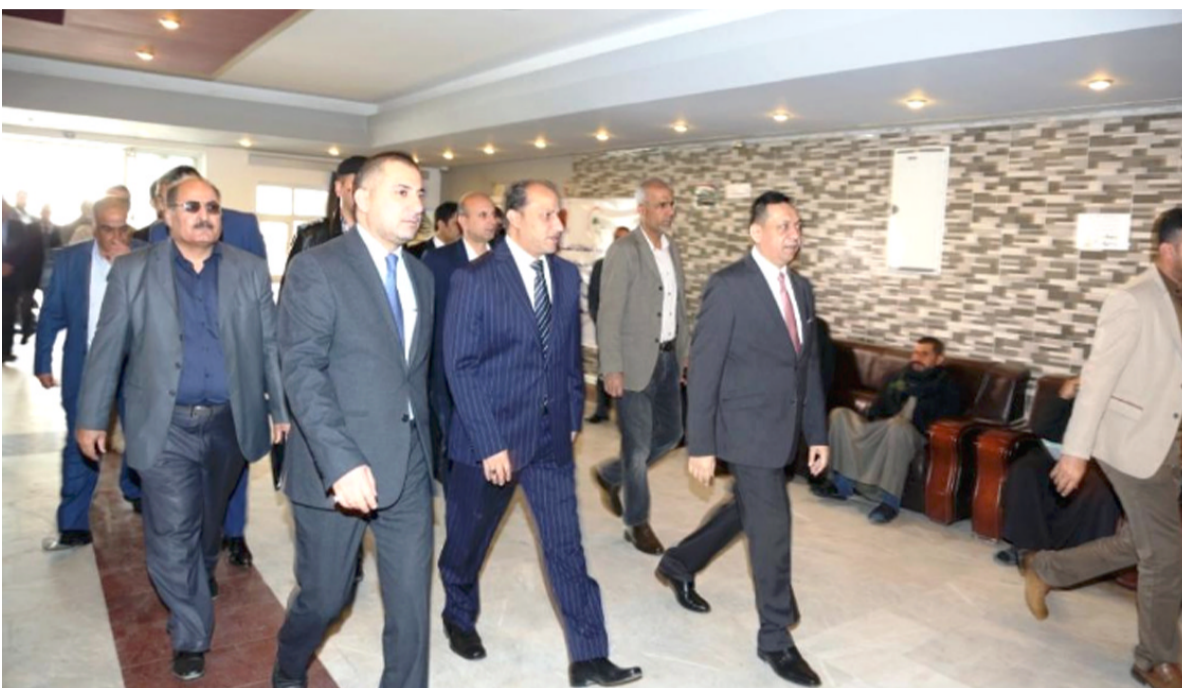
زيارة: محافظ ذي قار خلال احدى زيارته الميدانية