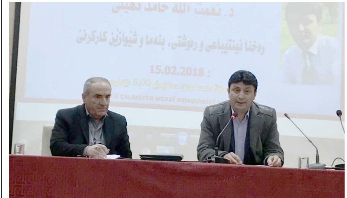
احدى الجلسات النقدية في دهوك