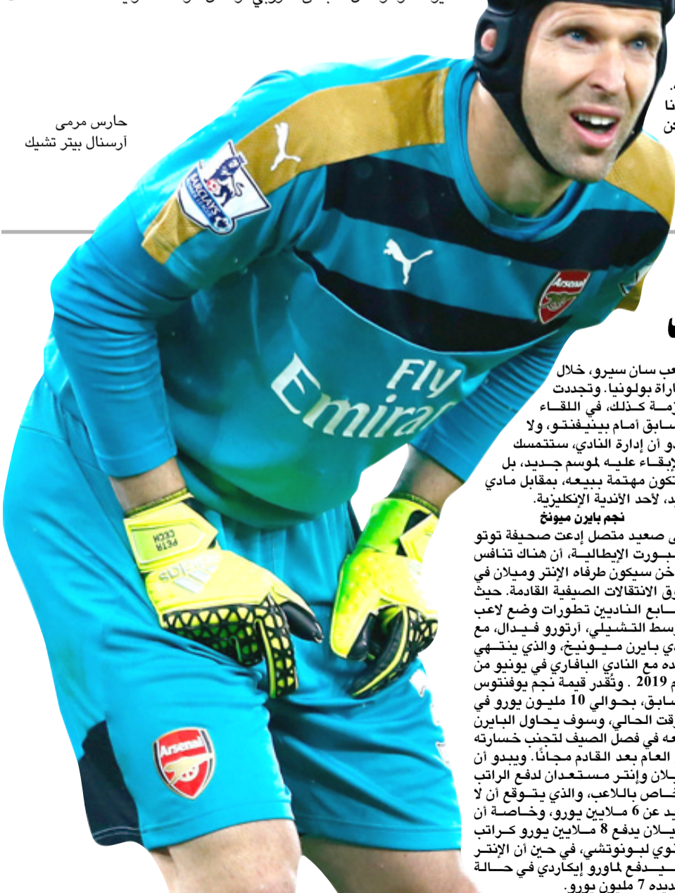
حارس مرمى أرسنال بيتر تشيك

□ الرياض - وكالات: تستضيف السعودية، اليوم الأحد وغدا الإثنين، الإجتماع الأول لمؤتمر أطراف اتفاقية اليونسكو الدولية، لمكافحة المنشطات، في دورتها السادسة، تحت رعاية رئيس اللجنة الأولمبية السعودية، تركي بن عبد المسن آل الشيخ وتترأس المملكة العربية السعودية، المؤتمر في دورته الحالية، حتى نهاية عام 2019، ويضم 188 دولة، حيث سيحضر الإجتماع أعضاء المكتب التنفيذي الذين يمثلون المجموعات الـ 5 المعتمدة من اليونسكو، ويمثلون القارات الخمس كما يحضر الأمين العام لاتفاقية اليونسكو، وممثل المجلس الأوربي، وممثل الوكالة الدولية لمكافحة المنشطات.