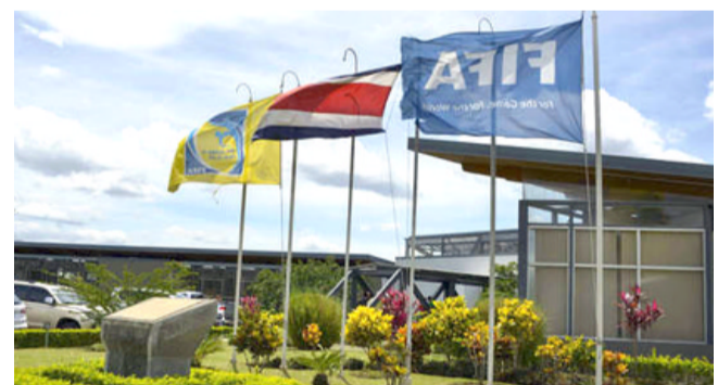
مقر الاتحاد الدولي لكرة القدم

□ زيورخ - وكالات: دافع جيانبي إنفانتينو، رئيس الاتحاد الدولي لكرة القدم (فيفا)، عن الوقت الذي تستغرقه تقنية حكم الفيديو المساعد لحسم القرارات المحيرة للجدل، قائلاً إن هذا الأمر لا يقارن بتوقفات عديدة حول مدى تأثير استخدام التقنية على روح اللعب. إنفانتينو استخدم استخدام حكم الفيديو المساعد، ويقول إن التقنية ستساعد على إنهاء الأخطاء الشائعة للجدل، مشيراً إلى تراجع عدد الأخطاء في البطولات التي استخدمت فيها هذه التقنية. لكن هناك تساؤلات حول مدى المراجعات والتعديلات الجديدة، قبل أن يراجع الحكام الأمر ويلغون الأهداف. واستخدمت هذه التقنية بالفعل في الدوري الألماني والدوري الإيطالي هذا الموسم، وتم تجربتها أيضاً في بعض مباريات كأس الاتحاد وكأس الرابطة في إنكلترا. وقال إنفانتينو إن انتظار بعض الوقت للوقوف على القرار الصحيح من حكم الفيديو المساعد، هو لمن يسيطرون على السوابق. وأضاف في مؤتمر صحفي إلكتروني عبر الإنترنت، أن امس الجمعية، من بين الانتقادات الوقت الذي يستغرق للحصول على قرار، وكثير من الناس تحدثت عن هذا الأمر دون معرفة.