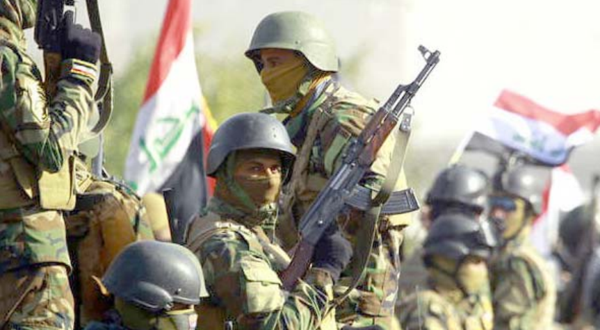
عملية: قوات من الجيش تتجه الى الحويجة للقيام بعملية أمنية ضد خلايا داعش

فضح الارهابيين المختبئين بينهم). وتكر بيان اعلام الحشد