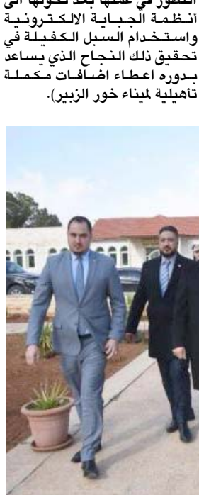
زيارة: وزير الداخلية يزور معسكراً أمنياً في العاصمة الأردنية

عبر طريريل وبغداد أمن الامر الذي يستعجس على تعزيز الحركة الاقتصادية والتجارية بين البلدين. وتكر بيان لهيئة المنافذ وتيسير حركة النقل عبر المجرى والسماح بوصول الشاحنات الى وجهتها النهائية في كلا البلدين حيث ستباشر الشاحنات الأردنية بالدخول للأراضي العراقية، وهنا الملقي الشعب العراقي الشقيق على الانتصارات التي حققها في حربه على التنظيمات الارهابية وفي مقدمتها عصابة داعش الارهابية، معرباً عن فحة الفرقة العراقية على العودة الى سابق مجده من خلال تلاحم كافة ابناء الشعب العراقي وحرسهم الاكيد على حماية وطنهم من جهة اعرب الاعرجي عن شكر العراق وتقديره لمواقف الاربين الداعمة للعراق وجهوده في محاربة الارهاب، مؤكداً ان العراق بكافة اطيافه ومكوناته قد انتصر على الارهاب ويحتل بصورة مسحة نحو المستقبل، ولفت الى التعاون الوثيق بين وزارتي الداخلية في كلا البلدين لتأمين حماية الحدود من كافة اشكال التهريب، مؤكداً ان الطريق بين