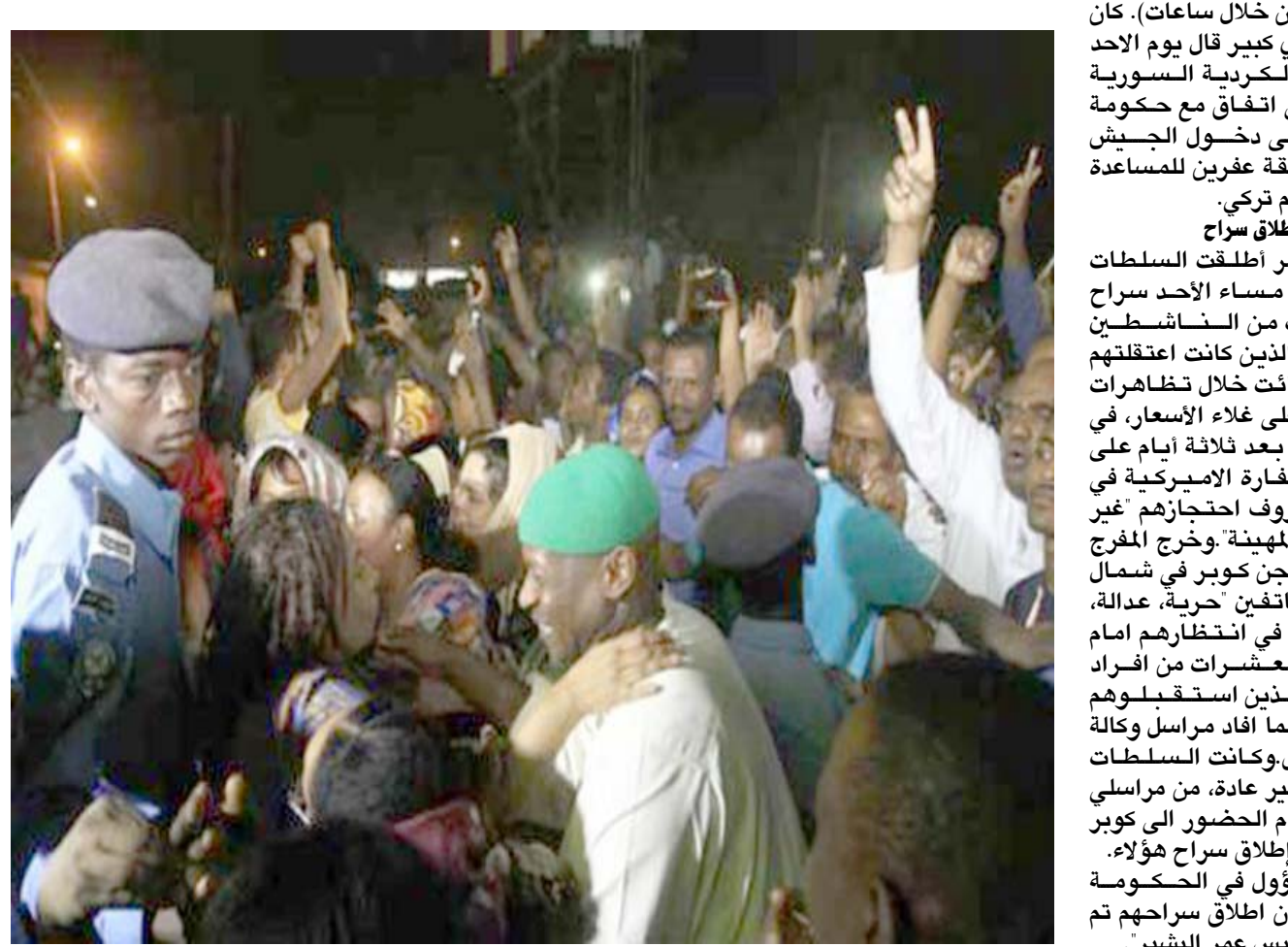
إطلاق: عوائل المطلق سراحهم تقف عند مكان الاحتجاز

من جانب آخر أطلقت السلطات السودانية مساء الأحد سراح العشرات من الناشطين والمعارضين الذين كانت اعتقالتهم الشهر الفائت خلال تظاهرات احتجاجية على غلاء الأسعار، في خطوة تأتي بعد ثلاثة أيام على انقضاء السفارة الأميركية في الخرطوم لظروف احتجازهم "غير الإنسانية والمهينة". وخرج المفرج عنهم من سجن كوبر في شمال العاصمة هاتفين "حرية، عدالة، ثورة"، وكان في انتظارهم امام السجن العشرات من افراد عائلاتهم الذين استقبلوهم بالإحضان، كما أفاد مراسل وكالة فرانس برس وكانت السلطات طلبت، على غير عادة، من مراسلي وسائل الإعلام الحضور الى كوبر لتغطية خبر إطلاق سراح هؤلاء. وقال مسؤول في الحكومة للصحافيين إن إطلاق سراحهم تم "بامر من الرئيس عمر البشير". من جهته قال نجل رئيس الوزراء