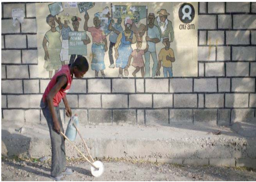
زلزال: طف في هايتي يلهو بعد انحسار الزلزال

إدارة عمليات أوكسفام في هايتي بعد زلزال وقع في 2010 واستقال في 2011. وقالت أوكسفام إنها نشرت تقرير 2011 الذي يوفق أيضاً اتهامات ضد آخرين بشأن ممارسة الجنس مع عاهرات في مسكن كانت أوكسفام تستأجره ويعملات بلطجة وترهيب كي "تتحلى بالشفافية بقدر الإمكان بشأن القرارات التي اتخذناها... واعترافاً بخيانة الأمانة التي نجمت عن ذلك". ولم يتسن لروبيترز الاتصال ببغاف هورميرين للتعليق.