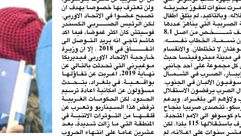
مواطن كوسوفي يحمل علم بلاده في احتفالية الاستقلال