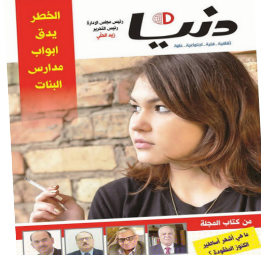
من كتاب العجيلة

لويس أنجلوس - وكالات: تقدمت الممثلة ميريل ستريب بطلب لتسجيل اسمها كعلامة تجارية. وتشير السجلات إلى أن ستريب قدمت الطلب إلى مكتب براءات الاختراع والعلامات التجارية الأمريكي في 22 كانون الثاني. وطلبت أن يكون اسم ميريل ستريب علامة تجارية لخدمات ترفيهية. وتضمنت ستريب (68 عاماً) الأسبوع الماضي لجائزة الأوسكار من دورها في فيلم (ذا بوست) لتكسر بذلك رقمها القياسي لتصل إلى 21 ترشيحاً. وفازت ستريب بثلاث جوائز أوسكار وثلاث جوائز إيمي وست جوائز جولدن غلوب خلال مسيرتها الفنية الممتدة لأربعة عقود والتي شاركت خلالها في أعمال سينمائية ومسرحية وتلفزيونية. ومن غير الواضح سبب تقدم ستريب بطلب تسجيل علامة تجارية في هذه المرحلة من مسيرتها ولم يرد محاميه ولا المتحدث باسمها على طلبات التعليق. ويقوم العديد من المشاهير بعمل علامة تجارية لأسماهم أو لاصطلاح شائع لحماية ملكيتهم الفكرية ومنع اناس آخرين من استخدامها بدون إذن أو للحصول على أموال من البضائع التي تحمل اسمهم.