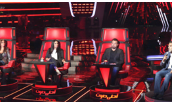
لجنة تحكيم (أحلا صوت) في كواليس التصوير

ام بي سي والذي تنطلق أولى حلقاته مساء السبت العاشر من شباط المقبل بمرحلة الصوت ويس، وهي اول مراحل البرنامج، حيث تتلف مقاعد النجوم - المدربين: عاصي الحلاني وأحلام وإليسا ومحمد حماتي، في تنافس على ضم اجز الأصوات التي تختار بدورها