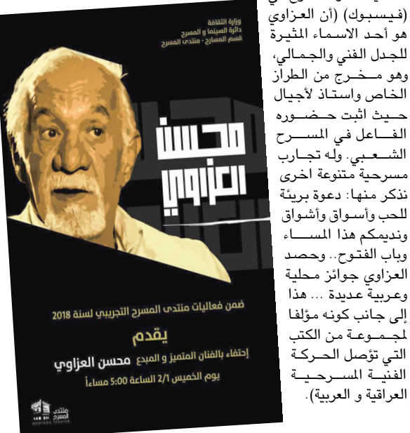
ضمن فعاليات منتدى المسرح التثريبي لسنة 2018 يقدم

يحتفي منتدى المسرح ضمن فعالياته المتنوعة لهذا العام 2018 بالفنان القدير محسن العزاوي في الساعة الخامسة من مساء اليوم الخميس في بناء المنتدى. وقال مدير المنتدى حيدر جعقة وفقاً لخبر نشر في صفحة دائرة السينما والمسرح في