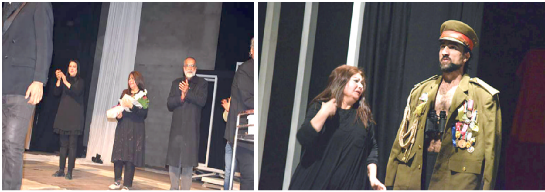
عمل جديد: مسرح الراقدين يضيف مسرحية (الأقوى)