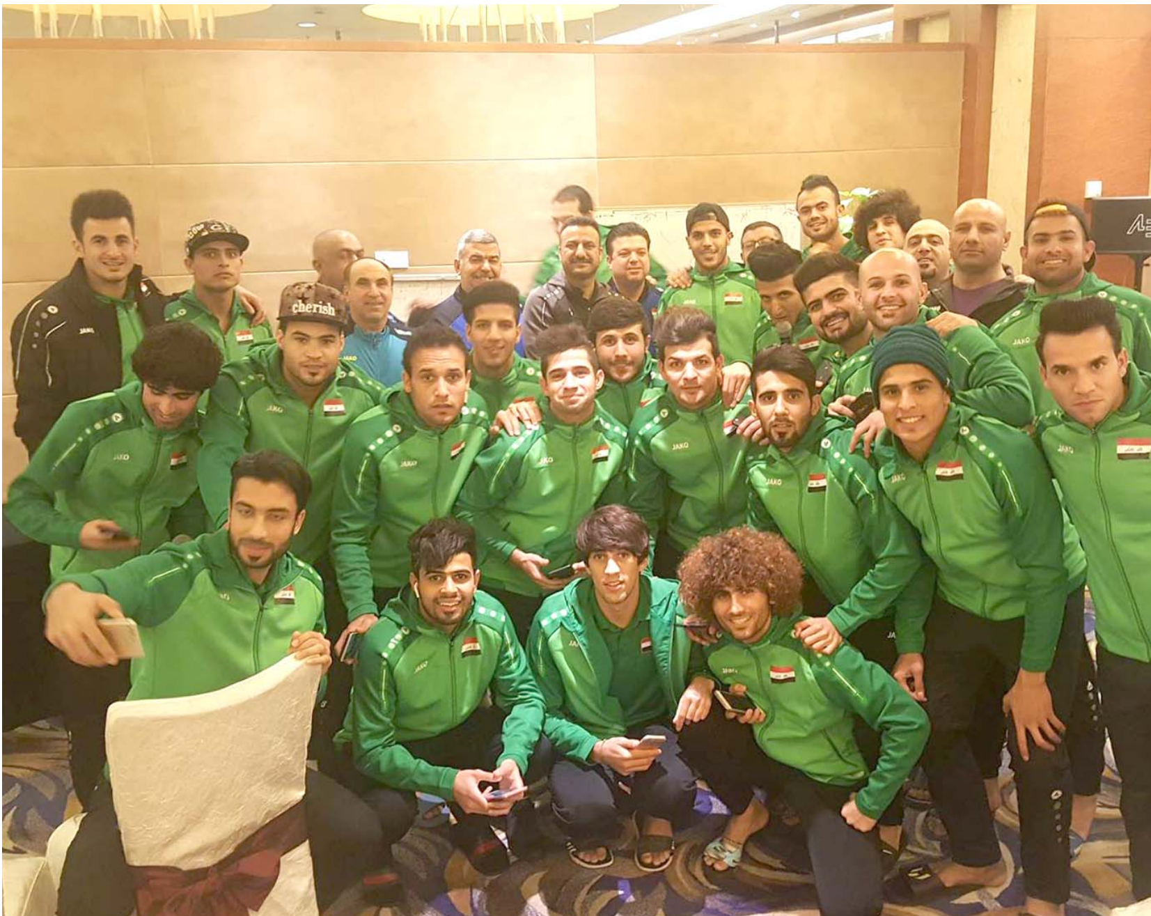
استعدادات: يواصل المنتخب الأولمبي استعداداته في الصين تاهيا لمواجهة فيتنام في ربع نهائي آسيا

الغني شهد قال في المؤتمر الصحفي الذي أعقب اللقاء كنا نعلم ان المنتخب الأردني سيدخل المباراة بحثاً عن خيار الفوز الذي ينقله الى المرحلة المقبلة لذلك فقد بادرتنا بالهجوم منذ الدقيقة الأولى وكندا ان تقدم في الدقائق الخمسة الأولى لكن كرتان ارتطمتا بعارضة المرمى واخرى مرت من جانب القائم ولم نمنحهم فرصة الوصول لمرمانا الا مرة او مرتين في الشوط الأول لكن الهدف الذي سجلناه بعد اربع دقائق من انطلاق الشوط الثاني جعل لاعبيننا يحاولون اللعب بحذر بشكل جعل المنتخب الأردني يبادر بالهجوم لاسيما في الدقائق الاخيرة لان ليس لديه شيء ليخسره فعمدنا الى اجراء تغييرين بالزج بلاعبين يمتلكون ميزة دفاعية أكثر منها هجومية ومع توفر عدد من الفرص خامر متوقع لاندفاع الأردني في لعبنا الا اننا بالمقابل اعتمدنا على الهجمات المرتدة التي اضغنا من خلالها أكثر من فرصة كان ممكن ان توسع فارق الاهداف لولا عدم استغلالها بصورة مناسبة ، وفي معرض اجابته على سؤال لمؤد الاتحاد العراقي للاعلام الرياضي بين شهد ان هناك بعض الأخطاء التي حدثت في خط الدفاع وهي امر طبيعي في ظل عدم تجمّع المنتخب لمدة طويلة وتواضع مدة الأعداد ، مشيراً الى ان مستوى المنتخب مباراة لثلاثين الذين لم يلعبوا لمدة طويلة فيها او لم يتشاركوا فيها ، معرباً عن ثقته في امكانية تصاعد مستوى منتخبنا في المباراة المقبلة من خلال حالة الانسجام التي بدأت تسود صفوف الفريق بعد المباريات الثلاث التي خاضها منتخبنا حتى الان في البطولة .