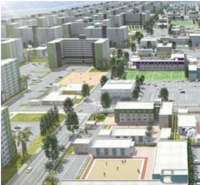
مباني، جانب من مشاريع سكنية تحت الإنشاء.

داعيا الى (استمرار عمليات الاقراض وتسهيل اجراءاتها مع خفض الفائدة بالتزامن مع توزيع الأراضي السكنية للمواطنين وتخصيص اراض جديدة لبناء مجمعات سكنية يهدف افلا أزمة السكن على المدى المنظور). واعلن البنك عن تخصيص مبلغ الى المجمعات السكنية، مؤكداً استمراره في تمويل قروض المشاريع الأخرى. وقال البنك في بيان انه (في إطار سياسة التحفيز الاقتصادي ومساهمته في التخفيف من أزمة السكن والبطالة يعلن البنك استمراره في تنفيذ تلك السياسة حيث تم اضافة مبلغ 500 مليار دينار للعام الجاري يخصص للمشاريع المجمعات السكنية في ضوء الطلبات الواردة الى البنك). لافتاً الى ان