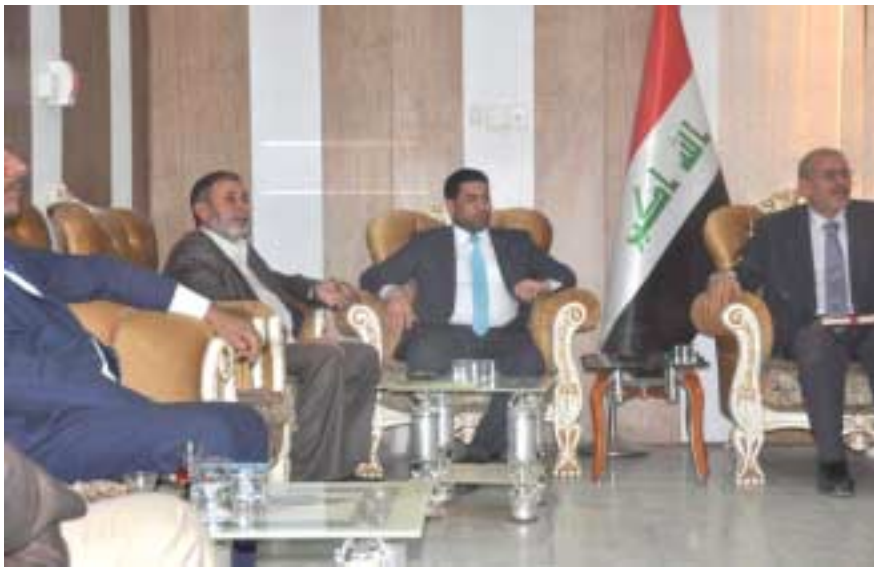
مدير دائرة الزراعة

وكان مصدر محلي في محافظة ديالى، اعلن عن اعدام 50 الف