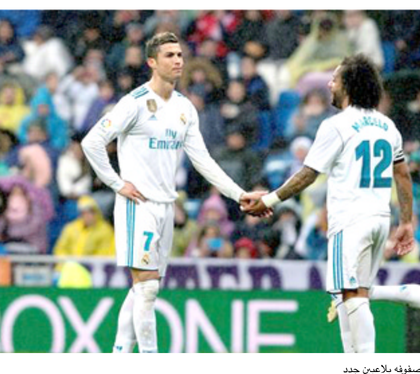
ريال مدريد يطمح إلى تعزيز صفوفه بلاعبين جدد