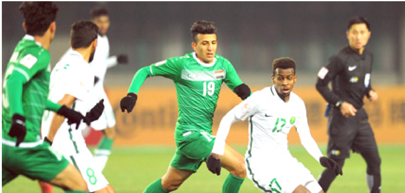
طموحات: يسعى الأمل إلى تجاوز عقبة الأردن ومواصلته الطريق في نهائيات آسيا