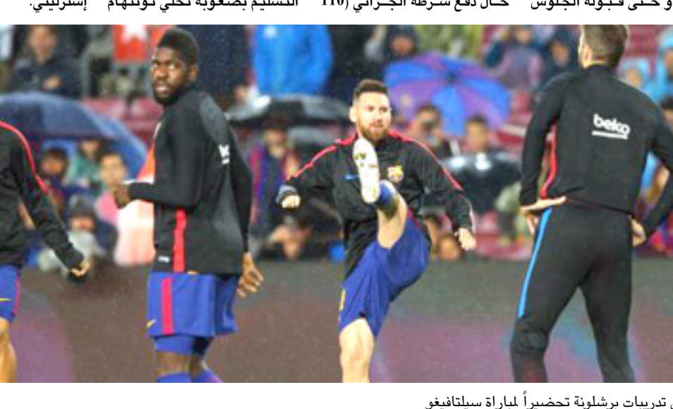
جانب من تدريبات برشلونة تحضيراً لمباراة سيلتا فيغو

عن نجمه الأول في هذه الفترة من الموسم، تظهر عقبة مطالبات توتنهام الضخمة، إذ من الممكن وصول سعره إلى أكثر من 200 مليون جنيه إسترليني.