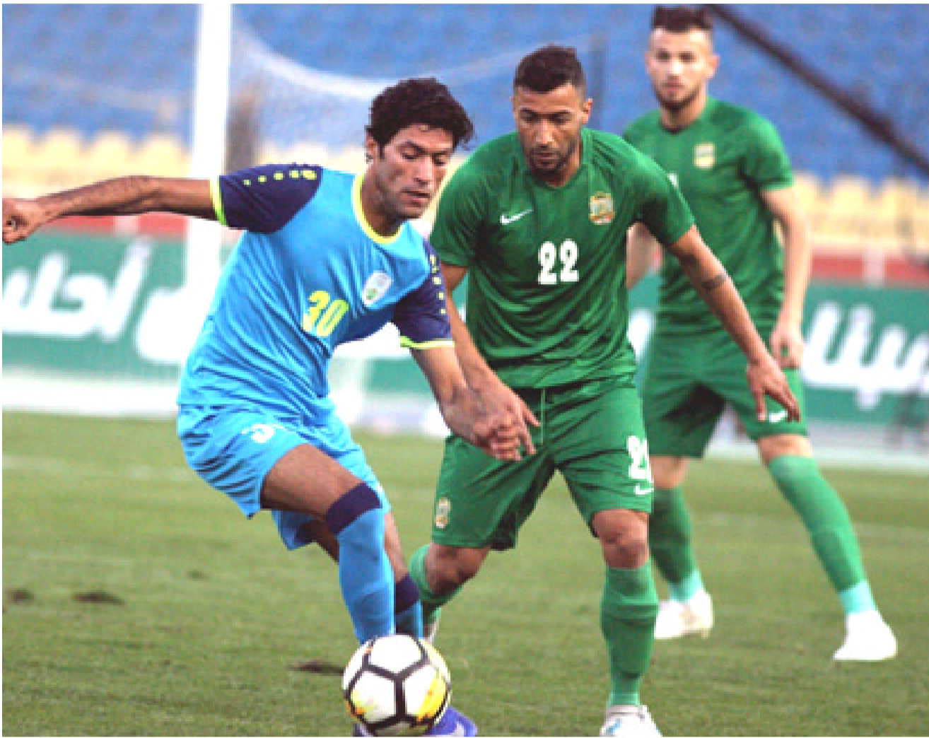
فوز: حقق الشرطة ثلاث نقاط ثمينة في مباراة أمام نطق الجنوب