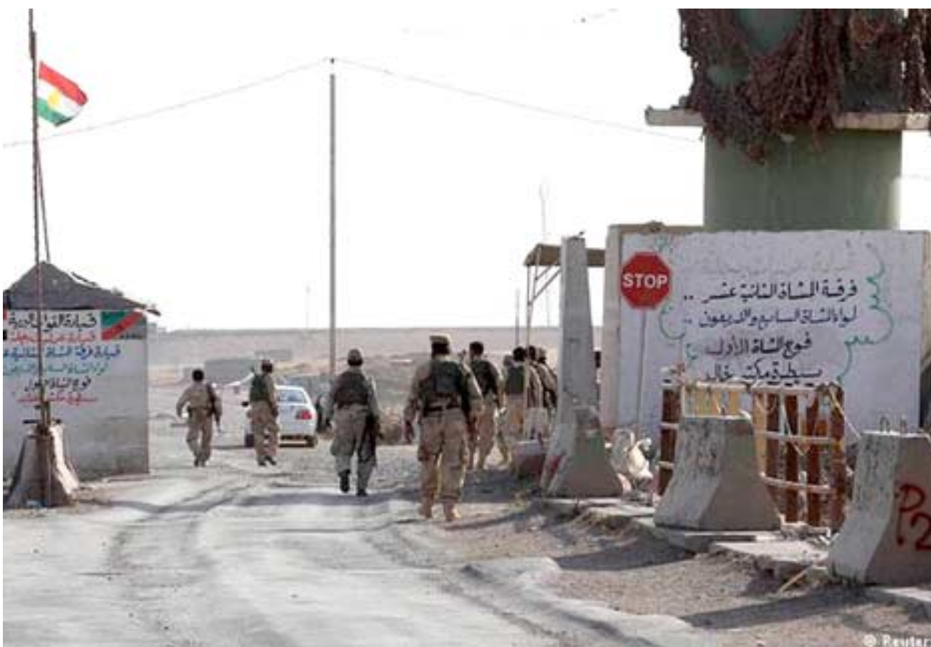
قوات سيطرة مكتب خالد تشهد انتشار قوات أمنية

ويقول فاضل محمود (نامل ان يستمر فتح هذا المنفذ كونه ينعكس على الحياة التجارية في مدينة الموصل فلاشك ان غلق هذا الطريق دفع وطائفة