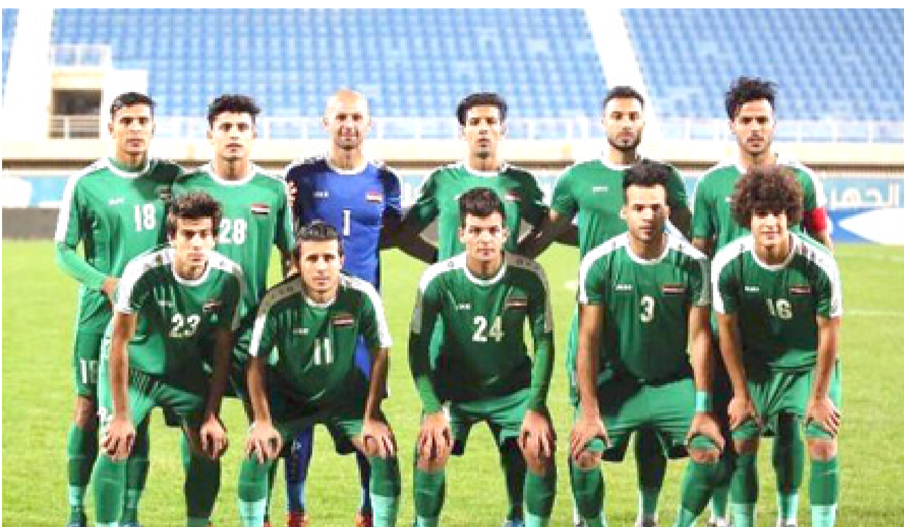
إطلاق: يسعى المنتخب الأولمبي إلى إنطلاقة قوية في مشوار نهائيات آسيا تحت 23 عاماً

اعتقد أن هذه المجموعة قوية وصعبة، لدينا تشكيلة جيدة من اللاعبين ونطمح لتقديم أفضل مستوى ممكن... وتابع، لا يوجد مباريات سهلة في مثل هذه البطولة القارية، ورغم أن معظمهم لاعبين محترفين، نحن ندرك أن المباراة الأولى تعتبر المفتاح لتكون في وضع جيد من أجل المنافسة في البطولة. وكشف، يجب أن نستفيد من المعلومات التي يمتلكها الفريق، لأن لدينا فريق جيد وسهوب، وفي ذات الوقت ندرك قوة المنتخب الأولمبي الذي سنواجهه في المباراة الأولى.