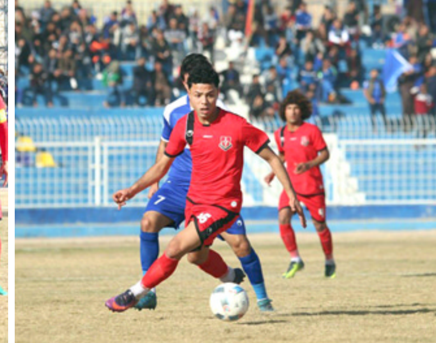
فريق الديوانية يخرج بنقطة ثمينة من لقاء فريق النجم في الدوري الممتاز