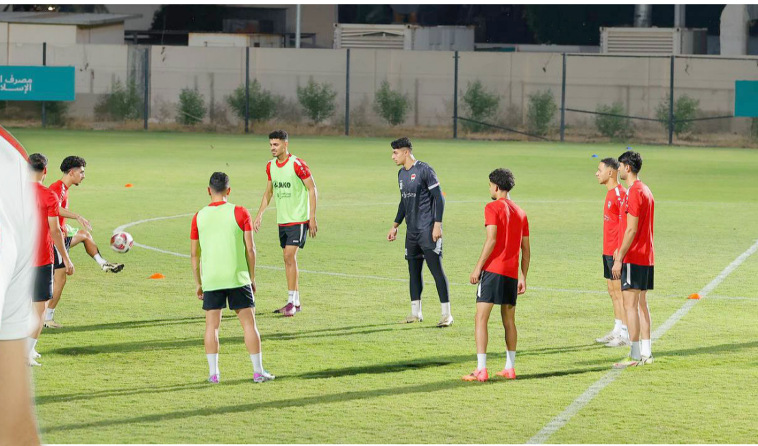
تدريبات المنتخب الوطني بجري وحداته التدريبية في البصرة

المجموعة لا يعني التقليل من شأن الوطني الذي حقق المطلوب الآن وأنهى المهمة قبل جولتين من التصفيات ومواصلته السجيرة في طريق التصفيات لحسن الوصول وتحقيق رغبة الشارع في اللعب ببنهايات كأس العالم ومتوقع أن يظهر بشكل آخر في التصفيات اللاحقة لأنه يمتلك عدد من اللاعبين القادرين على صنع الفارق وأخريين يلعبون في الدوريات المحترفة ومتوقع أن يظهر الفريق قدراته بشكل أفضل مع مرور الوقت وتحديات الفرق التي سيلعبها ما يتمتع به من إمكانيات فنية والوطني ظهر في أكثر من مناسبة بشكل منضبط ولعب بشكل جيد وأخرها في بطولة آسيا في قطر في ظل تالف نفس المجموعة التي تحطت اليوم والتي زادت ثقة والسجاسم ومهم أن يستعيد الوطني أسلوبه من خلال اللعب بتركيز والاداء الهجومي وتجاوز قلق المباريات وتدارك الاخفاء الدفاعي وتعزيز حالة الانسجام من فترة لآخرى وبات المدرب اكثر معرفة وعلاقة مع اللاعبين واعتماد الأفضل لحسم المباريات وبعد الذي تحقق يمثل دفعة قوية وحافز للمنتخب في حسم التاهل الرسمي لكأس العالم وقبلها أن المنتخب أخذ يدخل ويلعب متسلحاً بعامل الأرض والجمهور الاكبر اسيوي ومتوقع أن يحضر بكفاءة في لقاء فيتنام لغرض الاطمئنان على المنتخب قبل الانتقال للدور الحاسم كما تحسد عن ذلك المدرب كاساساس ومؤيد يمتلك فكرة واضحة عنها وهذا شيء مهم أمام مهمة اختيار التشكيلة القادرة على مواصلة المشوار وفي مواصلة تحقيق الانجازات وإن المباريات القادمة تتطلب العمل الاستثنائي والتركيز وحشد الجهود لحسم المباريات التي ستكون على مستوى آخر.