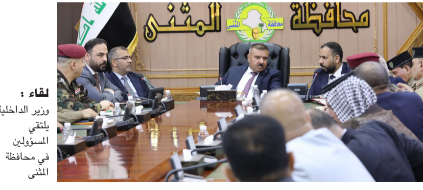
لقاء : وزير الداخلية يلتقي المسؤولين في محافظة ذي قار

في بيان تلقته (الزمان) أمس ان (مستحققات العاملين بصفة اجر يومي ستكون بمبلغ 350 الف دينار شهريا كحد أدنى ، وشمولهم براحة أسبوعية لا تقل عن يوم واحد وباجر كامل). كما افتتح الإبراهيمي، منتدى الغراف العالي، الذي نفذ بجهود ذاتية وعمل مشترك من قبل مديرية بلدتي ذي قار والغراف، وإشراك المحافظ إلى ان (افتتاح المنتدى جاء بهدف زيادة المساحات الخضراء وفتح مواقع وحدائق ترفيهية للمواطنين)، مؤكدا أن (المنتدى نفذ في وسط مدينة الغراف وتضمن اعمال ائارة ومساطر جلوس والعباب اطفال وزراعة ثيل وأشجار وباقي الاعمال الخدمية الأخرى)، وتابع ان (هناك خطة متكاملة لحكومة ذي قار لإضافة مساحات خضراء جديدة وتنفيذ مشاريع حيوية مهمة، وذلك في إطار خطة المحافظة لتطوير وتحسين الحدائق بمختلف المراكز والمدن لإعادة الرونق الحضاري وإيجاد متنفس جمالي لأهالي المحافظة).