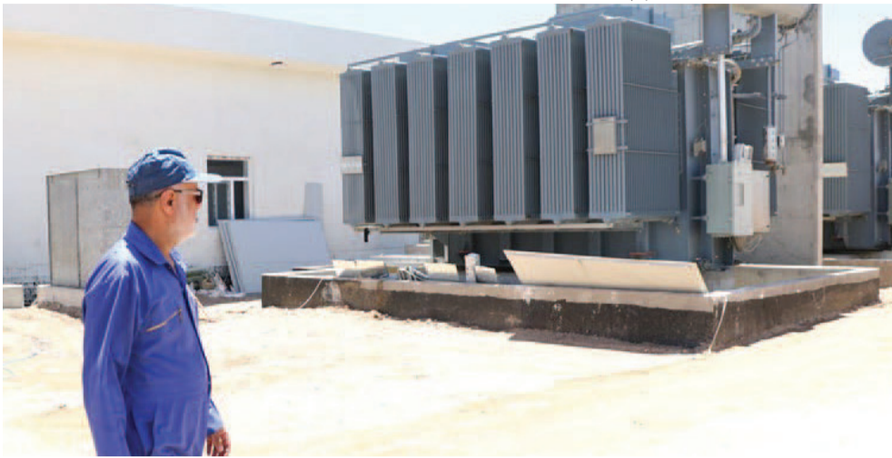
محطات : محافظ ميسان يتفقد المحطات الكهربائية خلال رمضان الماضي بالاستجابة لمطالبهم لكنه لم ينفذ وعده). من جانبه جدد اهالي منطقة السوادة كربلاء، مطالبتهم المحافظ بالاعمال التي مديرية الطرق والجسور في المحافظة، بوضع حل لهذا الطريق، وتحسب الخطوة لاهالي المناطق السكنية. ونكروا لـ (الزمان) اسم ان (الطريق شهد في الاعوام الماضية خلال الزيارات الميؤونية الكثير من الحوادث)، مشددين على (ضرورة