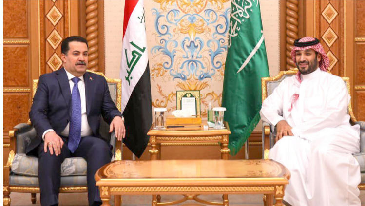
بحث : رئيس الوزراء ولي العهد السعودي التعاون

خلال العام المقبل، وتنجز المرحلة الأولى من مشروع استثمار الغاز المصاحب وبطاقة إنتاجية 50 مليون قدم مكعب، من أصل الطاقة التصميمية البالغة 300 مليون قدم مكعب. وشدد السوداني على (توفير كل متطلبات النجاح لشركة توتال إنرجيز في البرنامج الحكومي. وأكد البيان أن السوداني استقبل، الرئيس التنفيذي لشركة متخصصة بتكنولوجيا الزراعة والزراعة العمودية جيمي بوروز، حيث أعرب عن الرغبة في التعاون مع الشركة العالمية، ونقل التكنولوجيا في القطاع الزراعي إلى العراق، الذي يواجه تحديات التغير المناخي، ويعاني من شح مائي تسببت بزيادة مساحات التصحر، وتابع أن (الزراعة تشكل أولوية في البرنامج الحكومي، وقامت الحكومة بإجراءات وخطوات لتطوير القطاع وإبخال الأساليب الحديثة في الزراعة الري، إلى جانب دعم الفلاحين المزارعين والقطاع الخاص المعنى بالزراعة، التي تمثل إحدى ركائز الاقتصاد العراقي).