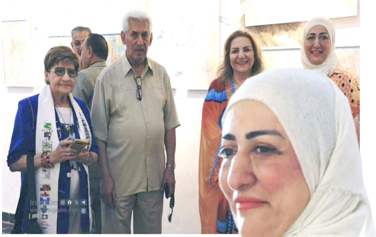
معرض : لقطات من معرض مي النعيمي