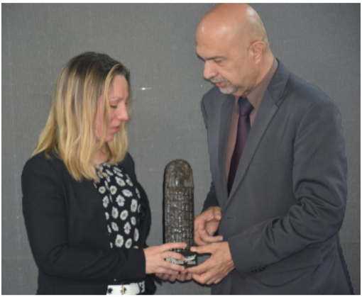
مهرجان: لقطات من مهرجان بابل للثقافات والفنون العالمية الذي عقد في محافظة بابل