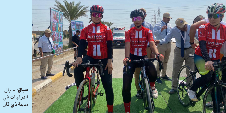
سباق: سباق الدراجات في مدينة ذي قار

والشباب فريق دهبوك والنساء فريق الكهرباء. وسبق انطلاق البطولة المؤتمر الفني الذي عقد في قاعة مديرية الشباب والرياضة في الناصرية بحضور عدد من اعضاء الاتحاد وممثلي الاندية المشاركة وحكام البطولة وقبيل المؤتمر الفني للبطولة رجب مدير الشباب والرياضة في الناصرية مهندس السهلائي بجعب الاندية المشاركة وانشاء بحضور الفرق المشاركة في