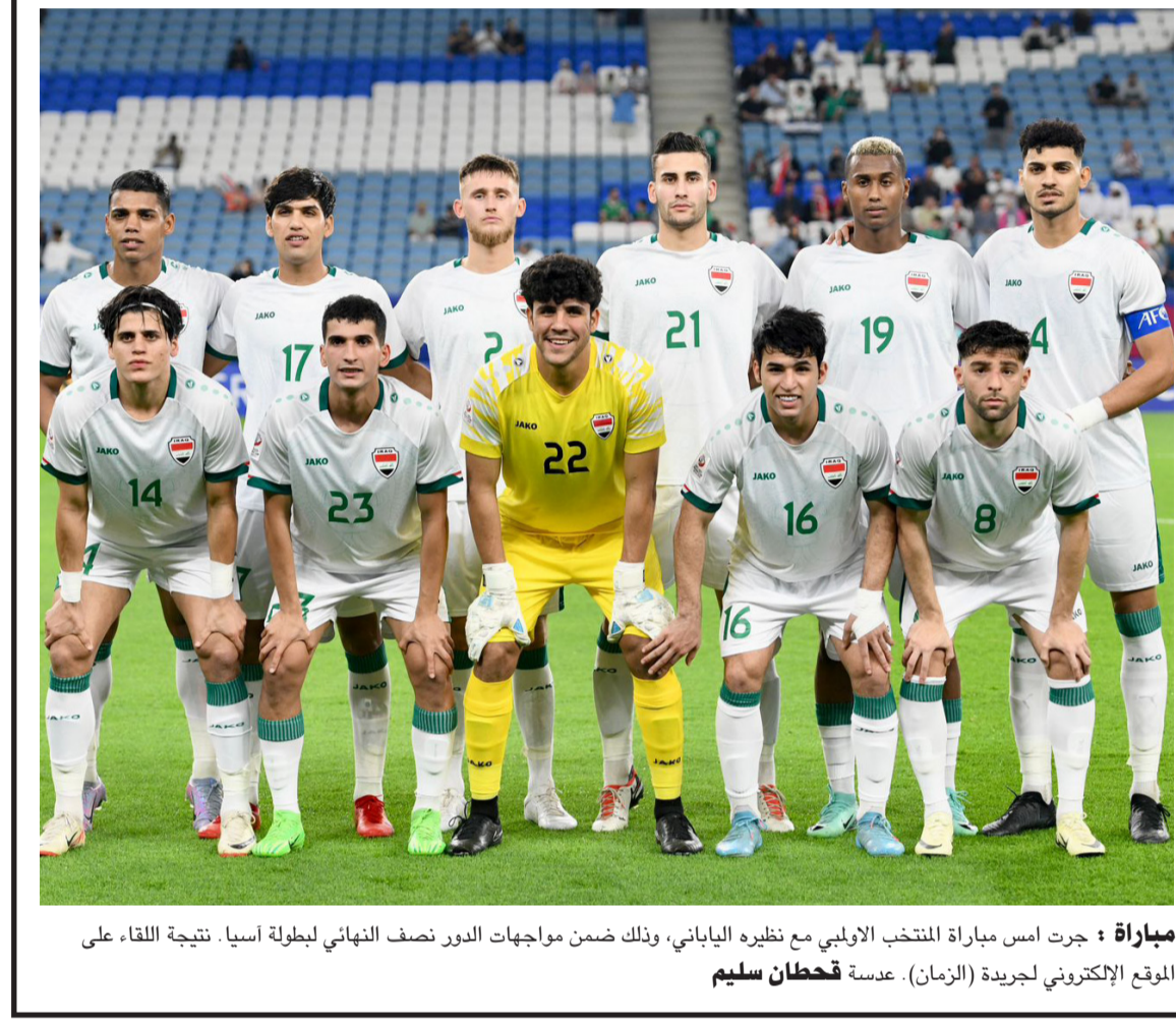
مباراة : جرت امس مباراة المنتخب الالبي مع نظيره الياباني، وذلك ضمن مواجهات الدور نصف النهائي لبطولة آسيا. نتيجة اللقاء، على الموقع الإلكتروني لجريدة (الزمان).

يستعد عمال العراق للاحتفال بالعيد العالمي، بوسط دعوات إلى الاستجابة لمطالبهم للحصول على حياة كريمة تتناسب مع غلاء المعيشة التي تشهدها البلاد، فيما شددوا على ضرورة أن تلتفت الحكومة لأوضاعهم من خلال جعل هذه المناسبة انطلاقاً لتأمين احتياجات الطبقة العاملة، وقالوا لـ (الزمان) أمس أنه (برغم التعديلات التي أجرتها الحكومة والبرلمان على القوانين الخاصة بحقوق العاملين، إلا أنها ما زالت لا تتناسب مع الظروف القاهرة التي تشهدها الطبقة الكادحة في البلاد، ولاسيما غلاء المعيشة وما يصعب علينا سد متطلباتنا نتيجة الأجور الزهيدة التي نقتاضها، مشددين على (ضرورة أن يكون للحكومة دور فاعل بهذا الاتجاه وتأمين حياة كريمة للطبقة العاملة التي تبذل كل ما يوسعها من أجل ديمومة مسيرة الإعمار والبناء، ودعا العمال إلى أن (إضافهم الذي يقع على عاتق الحكومة من خلال إعادة النظر ببعض التشريعات والقوانين النافذة، والمباشرة بتعديل رواتب الموظفين والعاملين في القطاعات الحكومية والأهلية بشكل يتناسب مع المتغيرات الشاغرة، وقالوا في حديث خريجو الكليات الحكومية بالإبقاء بوعودها وشمولهم بتعيينات الأواصل وحملة الشهادات، دون مراعاة الفئات الأخرى التي تنتظر منذ سنوات على أمل الحصول