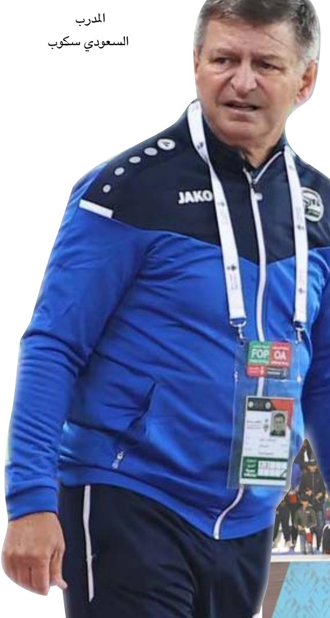
المدرّب السعودي سكوب