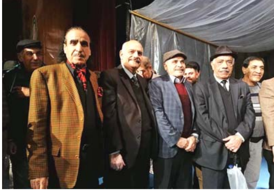
مسرحية: لقطات من مسرحية (ابصم باسم الله) على مسرح الطليعة