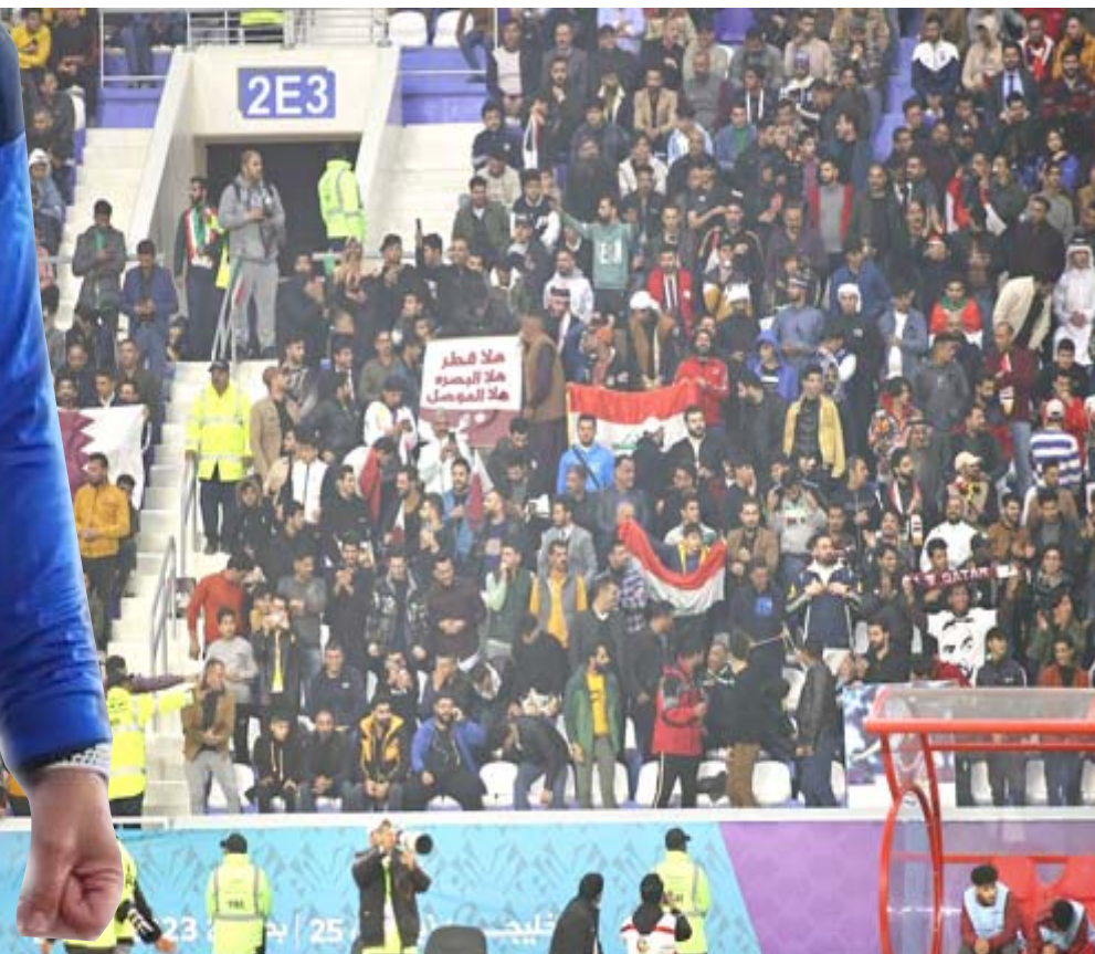
مؤازرة: الجمهور العراقي يوازي منتخب قطر ونظيره الكويتي في لقاءهما

ويامل الوطني ان تتعزف عمان امام اليمن لغرض الانفراد بالصدارة شريطة عبور عقبة السعودية وان تقوم بعض الاسماء في المنتخب بدورها وما مطلوب منها لدعم مهمة الفريق الذي سيكون امام الاختيار الحقيقي ونقطة التحول للرد التالي لكون مباراته الاخيرة امام اليمن الخميس .