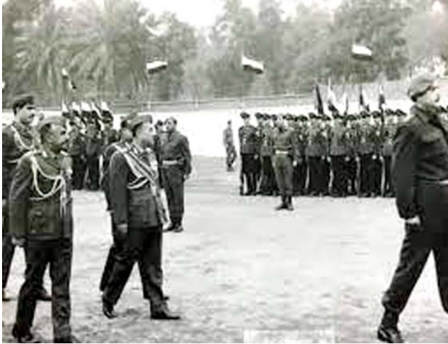
استعراض البكر وعماش يستعرضان أفواج الشرطة

1969 وعليه واحتفاء بالمنجز الذي تحقق للشرطة العراقية تم في بداية السبعينات اتخاذ قرار بجعل يوم بدء تطبيق القانون الجديد (الأول من نيسان) عيداً للشرطة وتم تخصيصه فيما بعد إلى يوم 9/1 وهو تأسيس الشرطة العامة عام 1922.