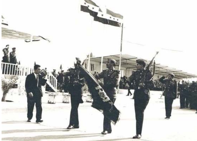
عقد: عرض عسكري في عقد الستينات