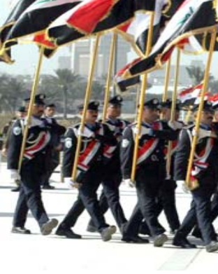
اعلام، عناصر من الشرطة يحملون اعلام الدولة

2- ضباط الجيش العراقي السابق الذين تم إعادة تعيينهم وأغلبهم كبار بالسن وتباركي الوظيفية عشرات السنين وتديوا كثير منهم مناصب قيادية بالشرطة مما أدى إلى التوسع المفرط في التوجه نحو العسكرية الواسعة لإدرات الشرطة، تشكل تهديداً خطيراً للأمن والسلم المدني في البلاد لعدم إلمام القادة العسكريين بالامهام الادارية والقانونية للحصاة هو المطلوب. نتيجة الأخطاء المتكررة بحدوث كارثية صاحبت عمل الشرطة نتيجة غياب المهنية بات من الضروري اصلاح واعادة هيكلة بعض الادارات لتحتاسب مع العصر وتتناس مع المرحلة لغرض النهوض بكل المهام بابعاده الجنائية لتحتفظ جبهتها الداخلية في إطار احترام