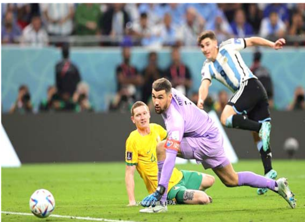
وفاة: منتخب أستراليا يودع المونديال باقدام ميسي

ما أراه حسما والخروج بالنقاط الثلاث التي قد تمخذه الصدارة اذا ما انت بقية النتائج لمصلحة فيما يحاول المتبادل الصناعة بنقطة تحقيق الفوز الأول ومحاولة عرقلة المضيف لتخريف من واقع المشاركة المرتكبة وفي ملعبه يسعى سادس الجول الزوراء 13 استعادة توازنه عقب خسارته أمام النصف الدور الماضي وهي الخامسة من سبع جولات عندما يواجه اختبارا صعبا حينما يستقبل مثل مدينة النصف الثاني الواسطلثاني عشر الذي عدل المهمة على حساب المرشح اللقب أيضاً: شكريا جزيلبا على كل شئ.