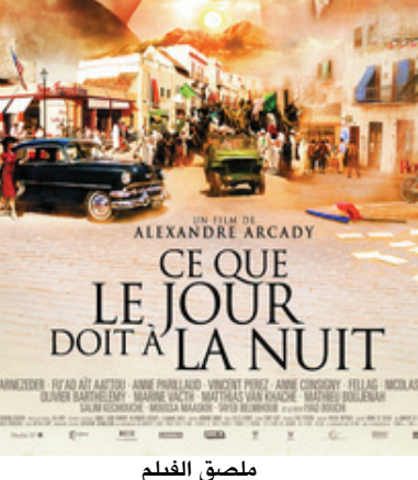
ملصق الفيلم مساحات الفيلم والتخيل عبر الأحداث، لكن لم تصقل المدينة والقيم الحدائنية الفرنسية

لقد احتفظ يونس برسائل أصدقائه وفاء منه لتلك الأيام، والملاحظ إن كل شخصية في رواية خضرة، صديقة وعدو لجوانس في وقت واحد، فكل واحد أحببت يونس الإنسان، وكرهه جوانس الإنسان أيضاً، لقد أيد خضرة في ربط بحث الحب عن يونس، وكيف أنهت إيميلى إلى إيجاد يونس، وكيف يعود إيميلى عنه لأنه أطاع هواه في ممارسة الجنس مع والديها الخبيثة الكبرى، والعقدة التي لا يمكن أن تحل، والتي قتلت يونس قبل وفاة إيميلى.