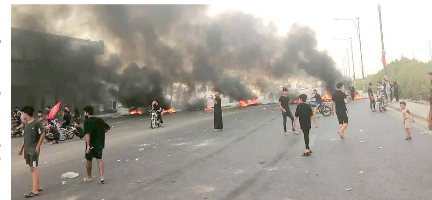
احتجاجات؛ متظاهرون في البصرة يحتجون على تراجع خدمة الكهرباء.

تسجيل البلاد معدلات قياسية في درجات الحرارة فيما هدد المتظاهرون بخطوات تصعيدية في حال عجز الحكومة عن توفير الكهرباء، وقال شهود عيان ان (المستمرات من المحتجين والطفغان)، وأضاف (ما أوججتنا إلى استلهام العبر والمعاني من هذه الذكرى الخالدة، وأن نستنهض الهمم ونوحد الصفوف وتتكاتف تحت سقف