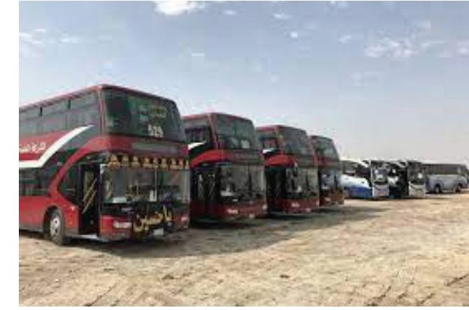
تضيرات : عدد من مركبات وزارة النقل