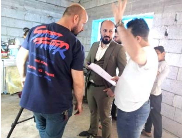
تصوير: كواليس تصوير فيلم (لعبة القاصرات)