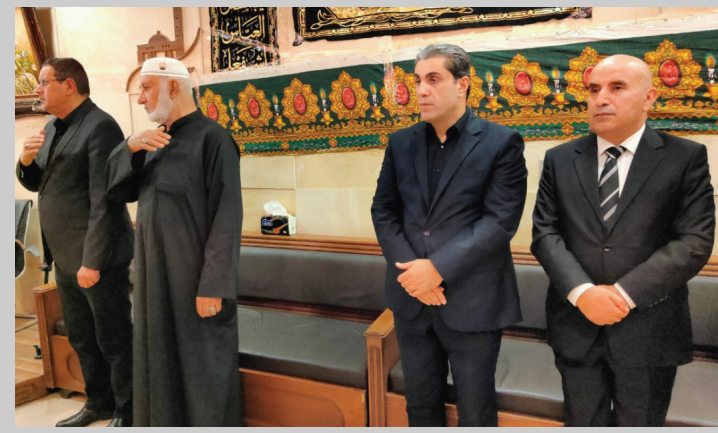
الحسيني الذي اقامته العتبة الحسينية المقدسة، في اربيل بذكرى عاشوراء.

أرى رئيس اقليم كردستان نيجرفان البارزاني، الحاجة ماسة اليوم في العراق لإستلهم القيم والمبادئ الإنسانية لذكرى استشهاد الامام الحسين بن علي عليه السلام في عاشوراء. وقال البارزاني في تغريدة اطلعت عليها (الزمان) امس، حيث يتمتع الاقليم بعبطة رسمية بالمناسبة، (تستذكر اليوم في العاشر من شهر محرم الحرام عاشوراء ذكرى استشهاد الامام الحسين عليه السلام تلك المفاجعة التي لا زلنا نستلهم منها دروس التضحية والوقوف بوجه الظلم لعلامة كلمة الحق.