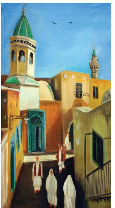
عدد من لوحات الترهوني

الواقع والطبيعة التي أبدعها الله، إذ أنني أرى الأرض والبحر والشجر صوراً والونا، كما أرى في عيون بعض الأشخاص مرآة تعكس إبداعات كثيرة مليئة بالحب والصدق والمحة، كذلك أرى في كل الأشياء صوراً تنقلها أحاسيسي بصدق وجمالية متكاملة. متى ترسم الفنانة سعاد الترهوني؟ لا بد من القول إن الفنان يجد نفسه من خلال لوحته ويشعر بالراحة عندما يمسك الفرشاة، لهذا فأنا أرسم عادة عندما تاتي لحظة ما قد تسبج الرسم بفارغ الصبر، إذ كان يفرحتي