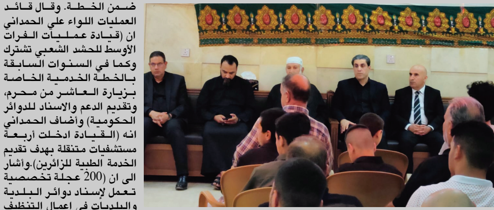
ضمن الخطة. وقال قائد العمليات اللواء علي الحمداي ان (قيادة عمليات الفرات الأوسط للتحرك الشعبي شارك وكما في السنوات السابقة بالخطة الخدمية الخاصة بزيارة العاشر من محرم، وتقديم الدعم والإسناد للدوائر الحكومية) وأضاف الحمداي انه (القيادة أدخلت أربعة مستشفيات منتقلة بهدف تقديم الخدمة الطبية للزائرين) وأشار الى ان (200 عجلة تخصصية تعمل لإسناد دوائر البلدية والبلديات في أعمال التنظيف