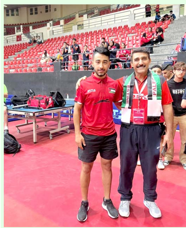
طاولة: حفر الفائزين ببطولة كرة الطاولة

العراق يحصد 13 وساماً في بطولة غرب آسيا لكرة الطاولة