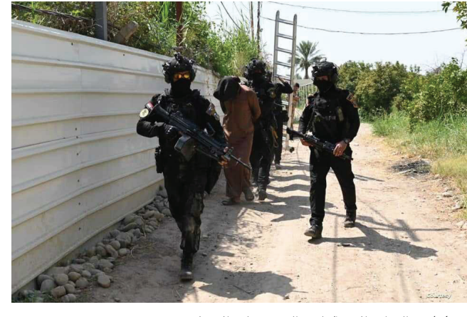
عناصر القوات الامنية تلقي القبض على الارهابيين

الحفاظات - مراسلو الزمان) أعلنت خلية الاعلام الامني، عن القبض على إرهابيين اثنين في بابل بعد استدراجهما من اقليم كردستان وقالت في بيان أمس إن