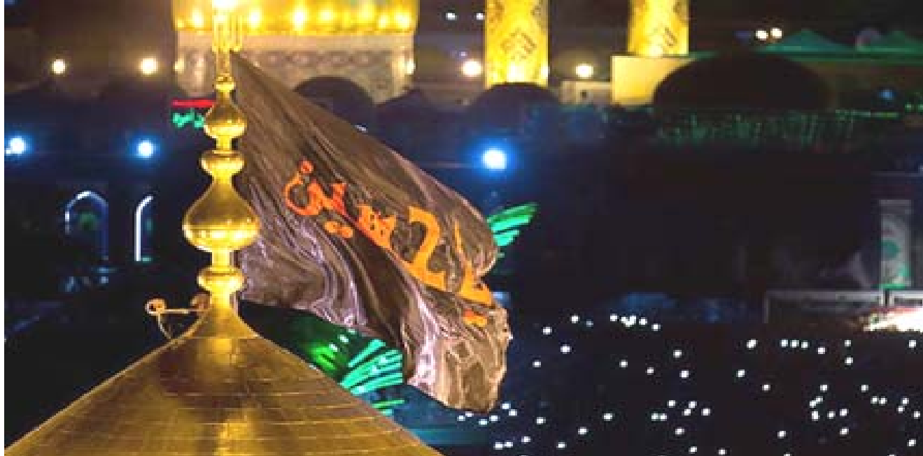
بغداد - الزمان