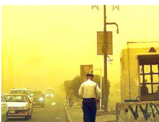
عواصف : مشهد لعواصف رملية تعطي مدينة

وقالت الصحفية في مقال لها، ترجمته (الجورنال)، إن موجة العواصف الرملية التي لا تهدأ في العراق هذا العام تسببت في وقف الرحلات الجوية وغلت المدن والبلدات بالعبار البرتقالي وأرسلت مئات العراقيين إلى المستشفيات بسبب مشاكل في الجهاز التنفسي. وأضافت، أنه بالنسبة لملايين الأشخاص في جميع أنحاء العراق يوم الخميس الماضي،