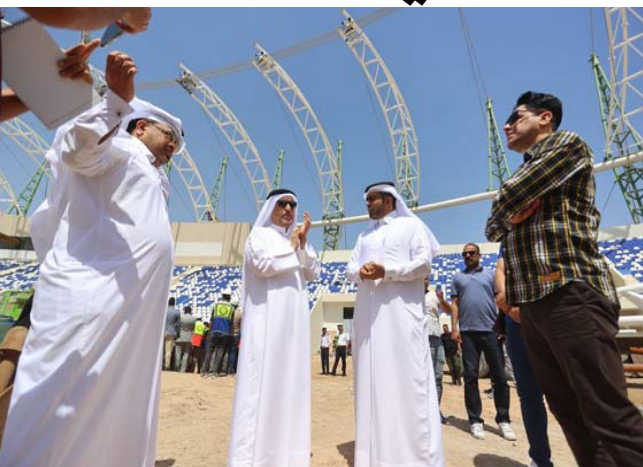
وفد: جانب من زيارة الوفد الخليجي بالبصرة

القرار المناسب بحق اللاعب بالبقاء أو الاستبعاد. وبدأ على قول سرتيب في حالة ابعاده سيلجأ الى لجنة الانضباط وأوضح الموسوي، أن لجنة الانضباط ليست هي من قررت ابعاده لكي يلحق بها، أما التسجيلات الصوتية التي نوه بها اللاعب فيإمكانه عرضها على اتحاد الكرة لنتخذ ما هو مناسب بحقه، لافتاً الى أن من غير الصحيح لجوء اللاعب الى الإعلام وهو في مقتبل العمر لاسيما أنه لاعب جيد ويمتلك الموصفات الفنية والمهارات وينظره مستقبل كبير لكن خروجه للإعلام يسبب أكثر من مشكلة.