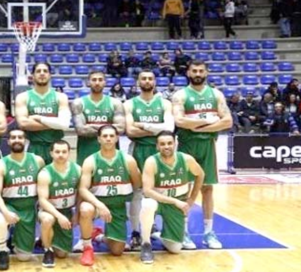
سلة؛ المنتخب الوطني لكرة السلة