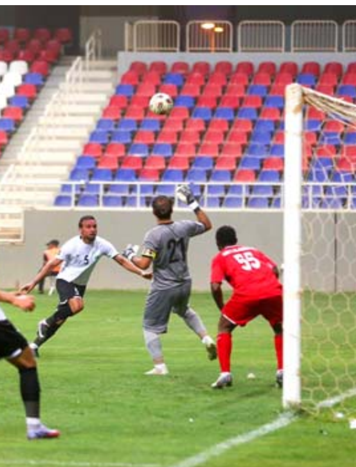
فوز؛ نطق الوسط بحقق الفوز على نطق البصرة في المئاز

عبد الغني شهيد الدرجة الاولى الموسم القادم وفيها يستقبل متصدر المجموعة الاولى بتسع نقاط الاتصالات سكر ميسان و تتطلع لمواصلة السير بتحقيق النتائج وكان قد تغلب على منافسه بهدف في اللقاء الاول ويسعى لدعم الموقف بشكل افضل من اجل الاقتراب من التاهل فيما استمر الاخر فاقدا للسيطرة على مبارياته ويواجه صعوبات المشاركة ويلتقي الخضسر والجولان وكلاهما يتطلع للنتيجة وكامل النقاط بعدما نجح الاول في الفوز بثلاثية نظيفة على مضيفه اليوم في مستهل التصفيات ويسعى المصافي لمعالجة الموقف بعد التأخر في المرحلة السابقة عندما يستقبل الصويرة والعلم من اجل الفوز الذي يبحث عنه الضيوف بعدما انتهى لقاؤهما السابق بالتعادل من دون اهداف ويحل متصدر المجموعة الثانية الحويجة بسبع نقاط ضيفا على الصويفية وكله امل لتحديد نتيجة التفوق في المرحلة الاولى فيما يسعى المضيف لتحقيق المهمة عبر دعم عاملي الأرض والجمهور.