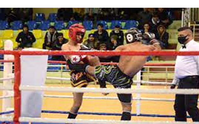
مواجهات: إحدى مواجهات الكك بوكسنگ