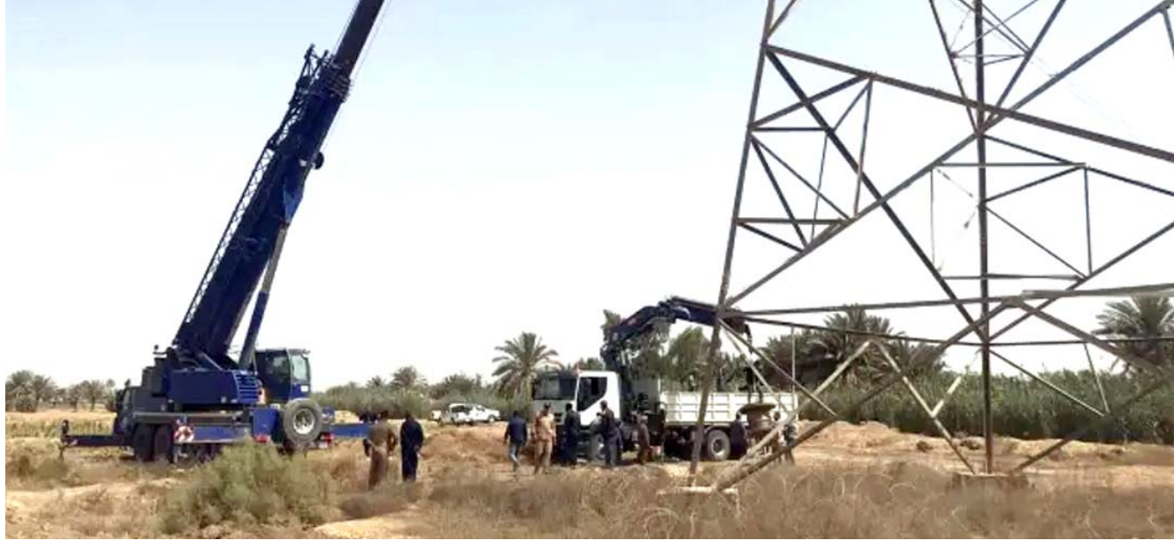
تأهيل : ملاكات الكهرباء تعيد تأهيل أبراج تعرضت للتخريب

حتى حزيران المقبل من هذا العام، ومتوسطة الأمد تستمر لعامين، سنوات ونصف السنة الى خمس سنوات، ونحتاج الى اربعة اعوام ونصف لنتكمن من انتاج 55 ألف ميفواط وان لم نتكمن من الوصول الى هذا العدد فسنواجه مشكلة ثقيلة ومؤثرة بحسب تعبيره.