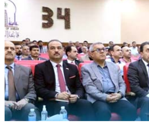
ورشة : مشاركون في ورشة عمل متقدمة

بغداد - رحيم الشمري تناولت طاولتان حواريتان عقدت على مدى يومين بالعاصمة بغداد ، تطوير المواقف وعرض التحديات التي تواجه اقرار التشريعات القانونية وكيفية تجاورها ، اقيمت ضمن مشروع دعم تشريع قانون الحماية من العنف الاسري ، ونفذت من منظمة تأهيل الارامل بالتعاون مع اوكسفام الدولية . بحضور اعضاء مجلس نواب البرلمان ، وممثلين عن الرئاسات والوزارات المختصة ، واكاديميين وباحثين وصحفيين ، وقدم فريق المشروع عرض لفترة امتدت لآكثر من عام لدراسة وتحليل وتدوين ما جرى والتحديات التي واجهت اقرار القوانين المهمة خاصة المتعلقة بالاسرة والمجتمع ، والمواقف والتوصيات والآراء ، حيث جرت نقاشات معمقة طرحت خلالها امثلة واقعية حدث بالبحية اليومية، والتي تستوجب توفر الغطاء القانوني وتعديل واقرار تشريعات حديثة تسير مع ما يحدث بالعام والتطور التكنولوجي والمجتمعي ، وركز عضو لجنة كتابة دستور جمهورية العراق لعام 2005 والنائب اربع دورات برلمانية الدكتور الشيخ عبيد وحيد العيسوي ، على اهمية التماسك المجتمع وتعزيز الروابط الاسرية ، والعراق يواجه استهداف خارجي يحاول النيل من المراه العراقية وشخصيات الشباب الناشي، وبخول الانترنت والاتصالات الحديثة سبب مشاكل لا نهاية لها، الا بالتصدي