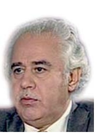
عبد الحسين شعبان