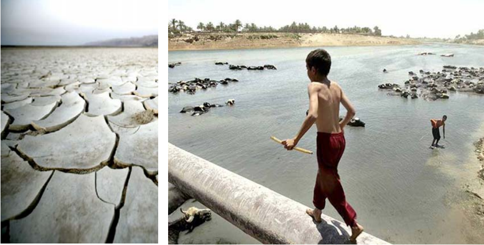
جفاف: آثار الجفاف تبدو على وجه الارض