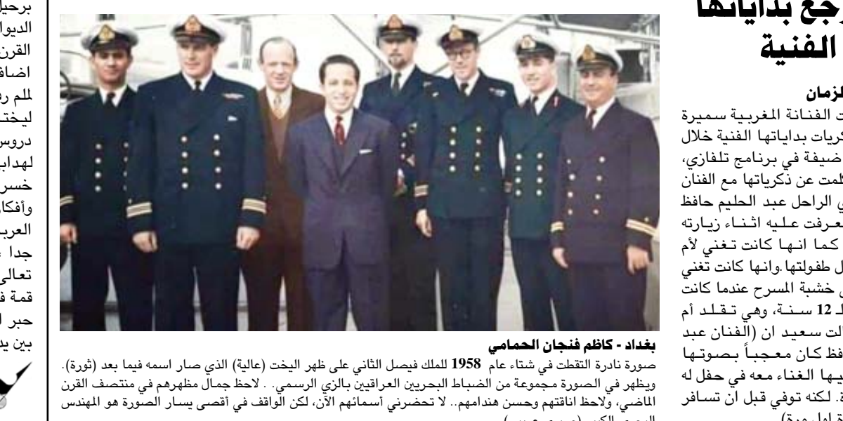
بغداد - كاظم فنجان الحمادي صورة تادرة التقطت في شتاء عام 1958 للملك فيصل الثاني على ظهر اليخت (عالية) الذي صار اسمه فيما بعد (ثورة). ويظهر في الصورة مجموعة من الضباط البحريين العراقيين بازي الرسمي. لاحظ جمال مظهرهم في منتصف القرن الماضي، ولاحظ انانقتهم وحسن هندامهم.. لاحظ خبرني أسماهم الآن، لكن الواقع في أقصى يسار الصورة هو المهندس البحري الكبير (صبري عريبي).