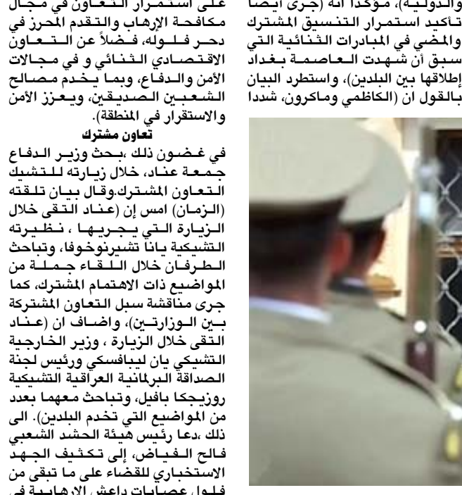
لقاء وزير الدفاع خلال لقائه بنظيرته التشيكية

بغداد - فايز جواد شدد رئيس الوزراء مصطفى الكاظمي، والرئيس الفرنسي إيمانويل ماكرون، على استمرار التعاون في مجال مكافحة الإرهاب، وقال بيان تلقته (الزمان) امس إن (عناد التقى خلال الزيارة التي يجريها ، نظيرته التشيكية بانا تشيرنوخوفا، وبتباحث الطرفين خلال اللقاء جملة من المواضيع ذات الاهتمام المشترك، كما جرى مناقشة سبل التعاون المشتركة بين الوزارتين)، ولفغ الى ان (ذلك يزيد من التقى خلال الزيارة ، وزير الخارجية التشيكي بان ليباسكي ورئيس لجنة الصداقة البرلمانية العراقية التشيكية روزجكا بايل، وتباحث معهما بعد من المواضيع التي تخدم البلدين). الى ذلك ، دعا رئيس هيئة الحشد الشعبي فلاح الفياض ، إلى تكثيف الجهود وبمناخبة شخصية من قبل الفريق الأول الركن عبد الوهاب الساعدي، نفذ اطراف محافظة كركوك، وقال الفياض