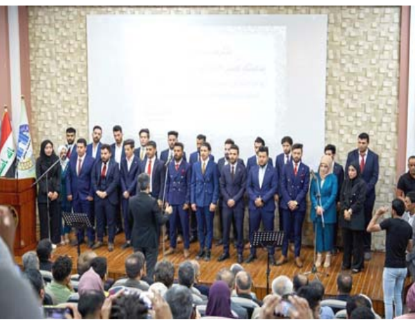
فعاليات: لقطات من فعاليات طلبة فنون بابل ومدرسة بغداد للفنون الموسيقية والتعبيرية