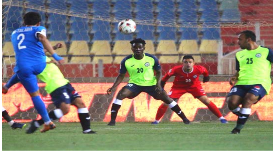
فوز: فريق الطلبة يحقق الفوز ويحافظ على وصافة الدوري