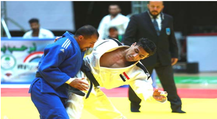
بطولة: احدى لقاءات بطولة بغداد الدولية للجودو

ان المشاركة في بطولة بغداد السلام الدولية للجودو تعتبر استعداداً للمنتخب التونسي للبطولة الإفريقية التي ستطلق في نهاية شهر ايار الحالي.