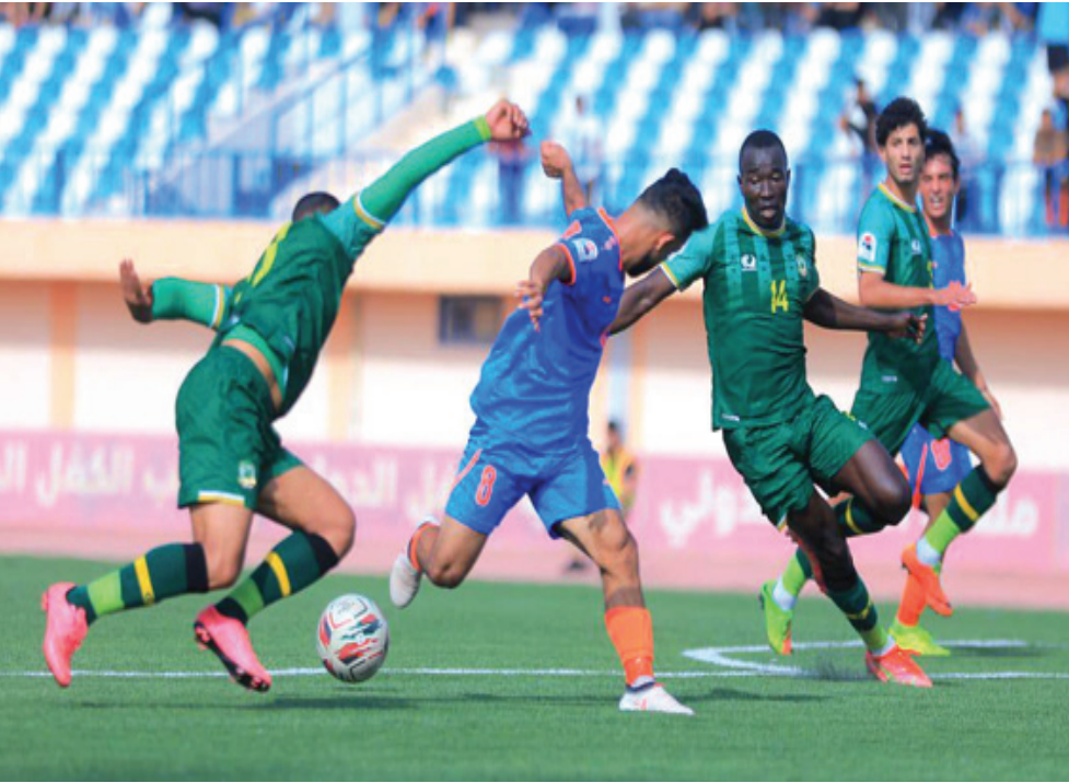
مواجهة : احدى مواجهات فريق الشرطة في الدوري

كانت غالبية لأصحاب الارض اصبحت الى العشر من ثلاثة انتصارات وتعادلين في أفضل فترة للامانة والتقدم للثالث عشر 35 فيما بقي الجوية ماضية الاخرة في مباراة مؤجلة وفرص آخر الوقت بعدما اندفع الجوية مهاجماً لكن دون جدوى قبل خروج كل منهما بتفسيطة