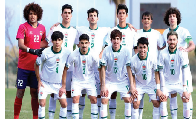
المنتخب الاولبي بكرة القدم

آخرين سيتم الإعلان عنها بعد إصدار الوثائق بشكل رسمي. وفي سياق متصل تلقى الاتحاد العراقي لكرة القدم موافقة من نظيره الإيراني على خوض منتخب بلاده دون 23 عاماً مباراتين في بغداد ضمن الإطار الودي تحضيراً لبطولة آسيا في أوزبكستان. خوض مباراة واوضح عربي: تلقينا موافقة الجانب الإيراني على خوض مباراتين في العاصمة بغداد يومي 24 و 27 من شهر ايار الحالي في ملعب المدينة الدولي، والمبارتان ضمن استعدادات المنتخب الأولبي لنهائيات آسيا التي ستقام في أوروپا، وهناك ملفات للاعبين