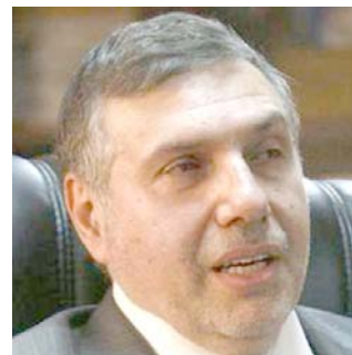
محمد توفيق علاوي

دولها الأعضاء من الدعوى القضائية. ولم يوضح حتى الآن كيف يمكن محكمة اتحادية تنفيذ أحكام قضائية لمكافحة الاحتكار على دولة اجنبية. لكن العديد من المحاولات لسن قانون نوبك على مدى أكثر من 20 عاماً، اختارت قلق السعودية، الرئيس الفعلي لأوبك، مما دفعها لممارسة ضغوط قوية في كل مرة تُطرح فيها نسخة من هذا القانون ولم يوضع البيت الأبيض ما إذا كان باينن يؤيد مشروع القانون، أو يحظى بتأييد كافٍ في الكونغرس للوصول إلى هذه المرحلة.