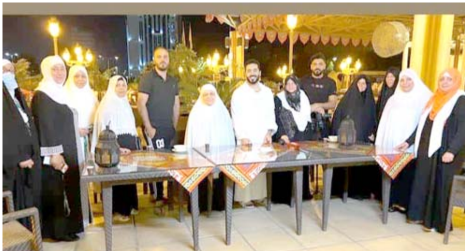
عمرة: لقطات من اداء الامهات المشاركات في برنامج (رحلة العمر) لمناسك العمرة