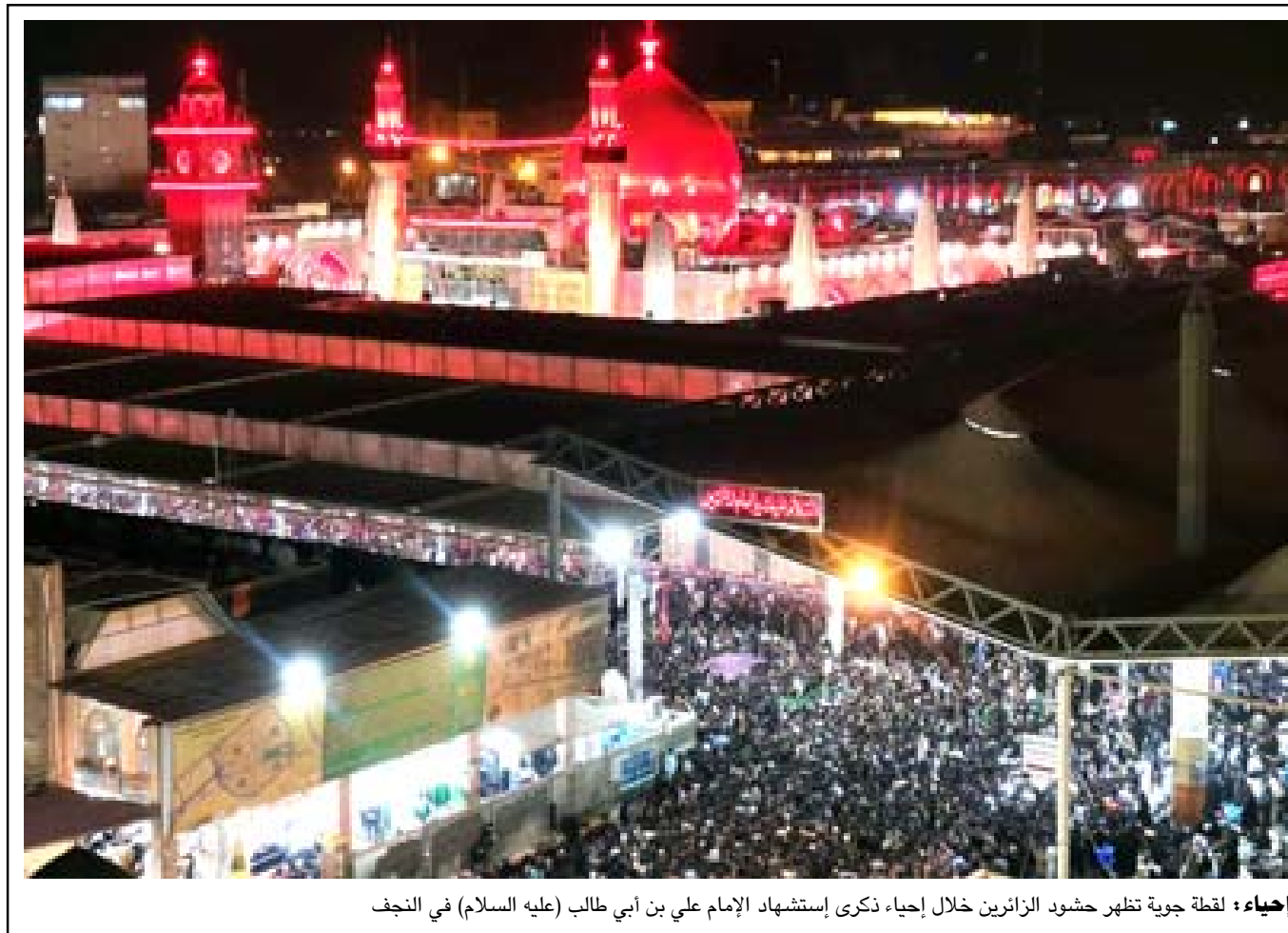
إحياء: لقطة جوية تظهر حشود الزائرين خلال إحياء ذكرى استشهاد الإمام علي بن ابي طالب (عليه السلام) في النجف

لوس أنجلوس - كالات - قال مصدر مقرب من نجمة برامج تلفزيون الواقع كيم كارداشيان إن قصة عثر طفلها على إعلان عن شريط جنسي، على لعبة ريبولوكس ليست مزيفة وفي المقطع، يظهر الطفل سايت ويست البالغ من العمر 6 سنوات، وهو يخلب من والدته رؤية الغرفة التي صادفها خلال قيامه بلعب ريبولوكس. وقالت ريبولوكس (إنها أزالَت الغرفة وحظرت أصحابها، وإنه لم يكن هناك أي وجود لمقطع جنسي بالفعل، في أي وقت) وأضافت أن (بعض عشرات من اللاعبين شاهدوا الإعلان، خلال فترة ممارسة اللعبة لفترة قصيرة).