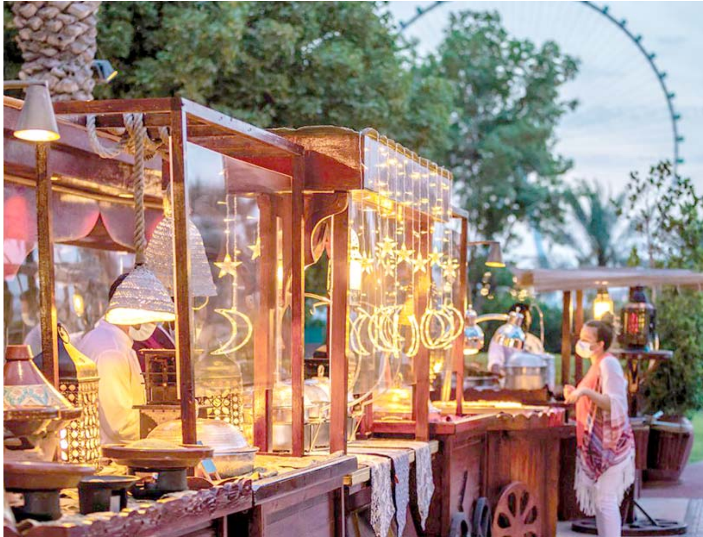
مجسمات: تستقبل دبي شهر رمضان الفضيل في أبهى حلة من خلال الجسيمات وتصاميم الإضاءة التي تتوزع في العديد من الأماكن في المدينة للاحتفال بهذا الوقت المميز من العام