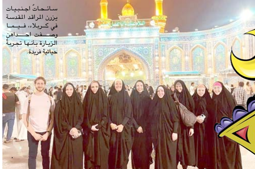
ساعات اجنبيات يزرن المراقدة المقدسة في كربلاء، فيما وصفت احداث الزيارة بانها تجربة حياتية فريدة.

حُفَّت كرامة العراقيين وهيبة الدولة وفرض القانون بانتصاراته العظيمة في مقارعة عصابات داعش الإرهابية والخارجين على القانون) وفقا لبيان اعلام عمليات بغداد اطلعت عليه (الزمان) امس ، مجدداً قارة للجبهود الكبيرة التي يبذلها ابطال قيادة عمليات بغداد (قادة ضباط، مراتب) في تعزيز الاستقرار الأمني في عموم مناطق العاصمة (بغداد).