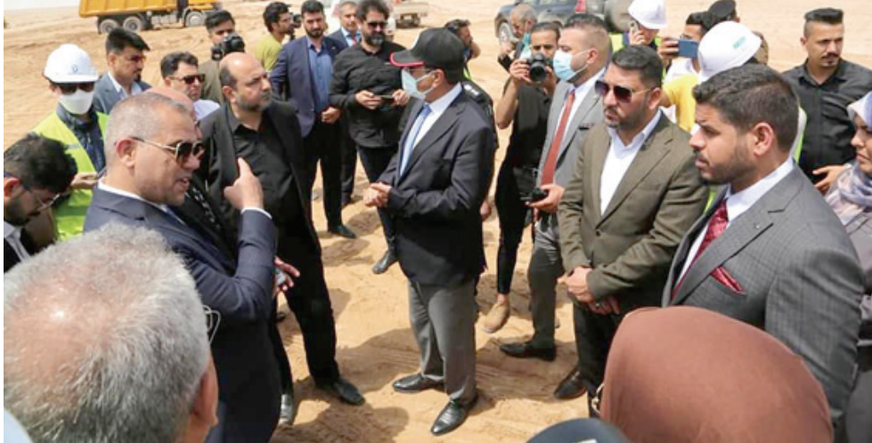
تفقد: وزير النقل يتفقد مشاريع البصرة

تماما من الخوارق). وتفقد وزير النقل ناصر حسين بنذر الشلبي خلال جولته الميدانية لشوارع النقل في محافظة البصرة الفجفاء، الاثنين، الطريق الرابط بين ميناء الفاو الكبير والطريق السريع باتجاه صفوان مروراً بالنفق المغمور، حيث يبلغ طول هذا الطريق 63 كيلو متراً ويكون ذا ممرين بكل اتجاه، ويبلغ عرضه 28 متراً، ويحتوي على مجسرين، الأول فوق طريق أم قصر السريع والثاني فوق طريق صفوان والذي يربط مع الخط السريع، يرافقه في جولته تلك عدد من أعضاء مجلس النواب ومدير عام الموانئ فرحان الفطوسي ومدير عام النقل البحري محيي الدين الامارة ومدير السلطة البحرية للاطلاع على كئيب على البية سير العمل والوقوف على نسب الإنجاز