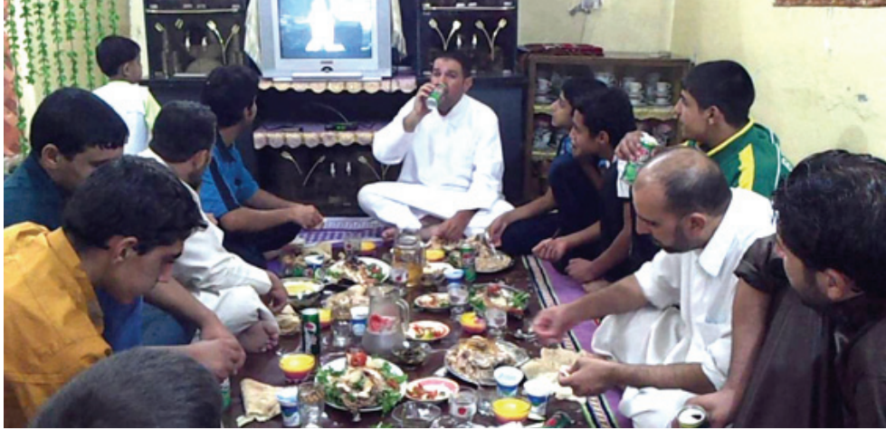
أفطار: عائلة تلتئم على مائدة الإفطار

الجسم خلال فترة الصيام.الحفاظ على نسبة السوائل في الجسم ، من الطبيعي ان يعاني الجسم من بعض الجفاف خلال الصيام، وهذا ما يسبب الصداع وعدم التركيز. لكن، يجب على الصائم الحرص خلال الساعات الممتدة بين الإفطار والسحور على تخفيف استهلاك القهوة او المشروبات الغازية، لأنها تدر البول وتسبب الجفاف، وشرب كميات كبيرة من السوائل الأخرى، مثل الماء او الشاي الخفيف دون الريضية، ثم يتنقل بعد ذلك إلى طبق الشورية، الذي يعد افضل خيار لبدء وجبة الإفطار لأنها غنية بالسوائل. إلى جانب ذلك، يجب الحد من تناول الطعام الدسم والمقلي والغني بالملح والسكر والابتكار من الخضار الورقية واختيار الاسماك واللحوم قليلة الدهن والحبوب اعدياد الكسب والرز الاسمر والياباستا اقل من الطعام، يمنع الجهاز الهضمي فرصة للاستراحة ويؤدي إلى تقلص حجم المعدة بشكل تدريجي والحد من الشهية، ويمكن ان يكون له نتائج أفضل من أكثر أنواع الحميات الغذائية فعالية . وجبة السحور الوجبة الأكثر أهمية في يوم الصائم، لذلك يجب ان تكون متوازنة وتحتوي على أطعمة غنية بالمواد الغذائية، مثل الشوفان والحببة والخبزة والفواكه والخضروات . وبعد الإفطار ذات مؤشر السكر المنخفض، مثل الشوفان والخبز والحبوب الكاملة واللبن والحمص، من الخيارات الجيدة لأنها تزود الجسم بالطاقة ببطء خلال النهار. كما من المهم الحد من استهلاك الشاي والقهوة والابتكار من شرب الماء والحليب واللبن والعصائر الطازجة، فذلك يساعد في الحفاظ على نسبة السوائل في