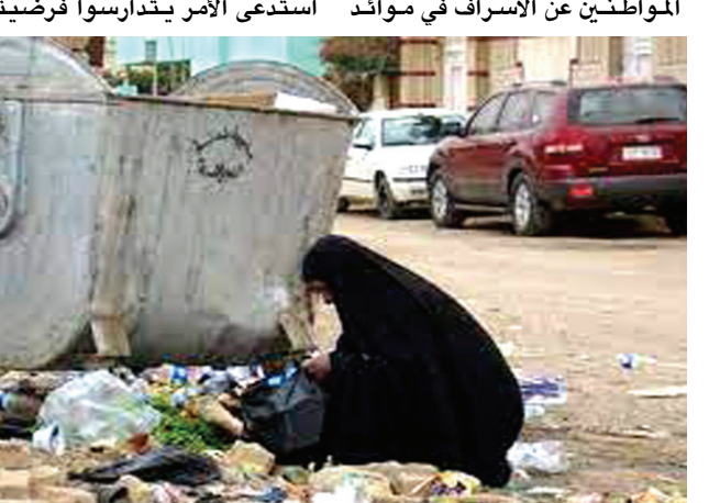
بعض امرأة فقيرة تبحث عن الطعام في مكب النفايات

بغداد - فنان جواد عادة ما يتبادل الأزواج فيما بينهم الاتهامات بالمسؤولية عن الإسراف والتبذير الذي يرافق الكثير من موائد الإفطار خلال شهر رمضان المبارك، ويلقى الزوج باللائمة على الزوجة التي تقع مسؤولية إعداد سفرة الفطور والسحور والمائدة عليها بالدرجة الأولى، فيما تحمل الزوجة على الزوج، الذي يطلب منها ان تملأ المائدة بمختلف أصناف الطعام والشرب والحلويات وغيرها . وبين هذا الاتهام وذاك، تتزايد مشكلة (الإسراف) على موائد رمضان، في وقت تكون فيه الأسرة أوجوح ما يكون إلى الاقتصاد والتبشيد والإحساس بالأخرين من الفقراء والمساكين . قال الله تعالى : كَلُوا وَاشْرَبُوا وَلَا تُسْرِفُوا إِنَّهُ لَا يُحِبُّ الْمُسْرِفِينَ . عادة مذمومة ويبقى الإسراف في الفطور والسحور عادة مذمومة ومرفوضة وتواجه انتقادات الأهل والأقارب والمعارف والاهم أنها عادات تخير حفيظة الفراء الذين لا يستطيعون تحوز المائل والمشرى على مائدة الإفطار وبالتالي حتى رجال الدين والبرجماتيات فكثير هذا السلوك الذي تحالو الفراء من العوائل التي ماتحمله موائد الفطور والسحور على مواقع التواصل الاجتماعي مايفير الفقراء من العوائل التي والتي لا تستطيع ان تملأ موائد الإفطار ربع ماتحمله العوائل التي تحرص على نشر مالد وطاب من موائد الفطور والسحور التي غالبها تذهب إلى النفايات وان يعلموا ان هذا حرام فيهد رمي سابقين من الطعام في الفضلات اسراف من دون مراعاة العوائل الفقيرة والمحدودة الدخل في شهر رمضان الفضيل . ( الزمان ) استطلعت بعض اراء المواطنين عن الإسراف في موائد