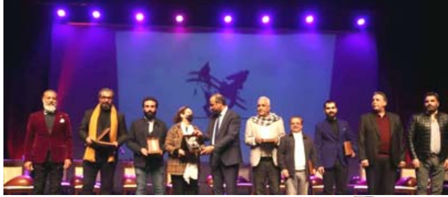
إحتفاءً : فعاليات متعددة في اليوم العربي للمسرح