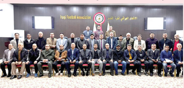
المشاركين في الدورة التدريبية