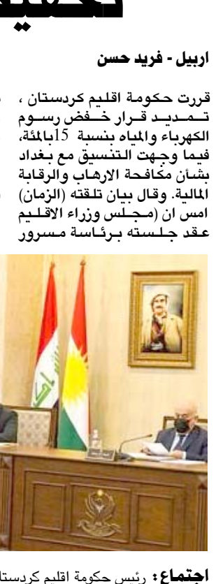
اجتماع: رئيس حكومة اقليم كردستان يترأس اجتماعاً لمجلس الوزراء

البرازاني وحضور نائبه قويد الطيالباني، وافق خلالها على نسبة خفض الرسوم البالغة 15 بالمئة حتى الشهر المقبل من العام الجاري). وأضاف ان (وزير الجيوشمركة شورش إسماعيل والداخلية رجب احمد، عرضا تقريراً عن الخطوات الأخيرة بشأن