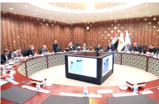
ورشة : وزير النفط في ورشة عمل

بغداد - الزمان يتدارس العراق مع شركة سينوك الصينية ، استكشاف رقع برية وبحرية في الخليج ، بعد استكمال الاجراءات اللازمة للعمل البحري مع الجهات المعنية، وشدد وزير النفط احسان عبد