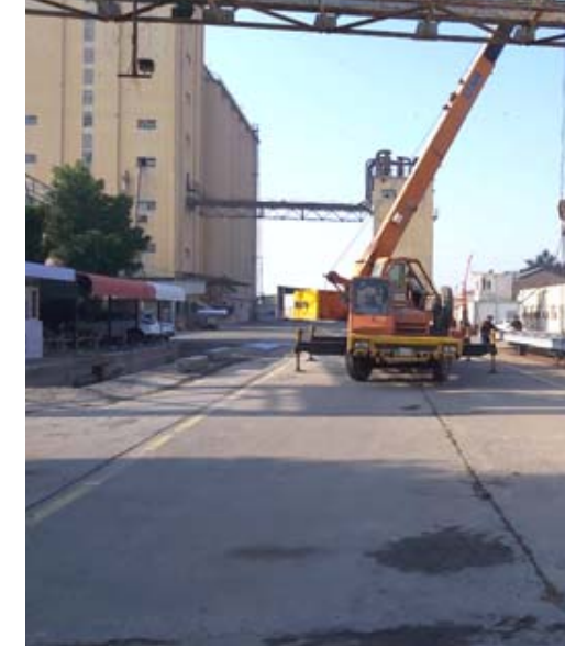
رافع : عمليات تأهيل في الرافع الثاني بالشرقاط

بغداد - عامر عبدالعزيز اعلنت وزارة التجارة عن تنفيذ الجهد الهندسي في مواقع الشركة العامة لتجارة الحبوب مجموعة من الاعمال الفنية مستقيدين من توقف ضغط العمل و قبل بدء استحقاقات موسم تسويق الحنطة 2022.