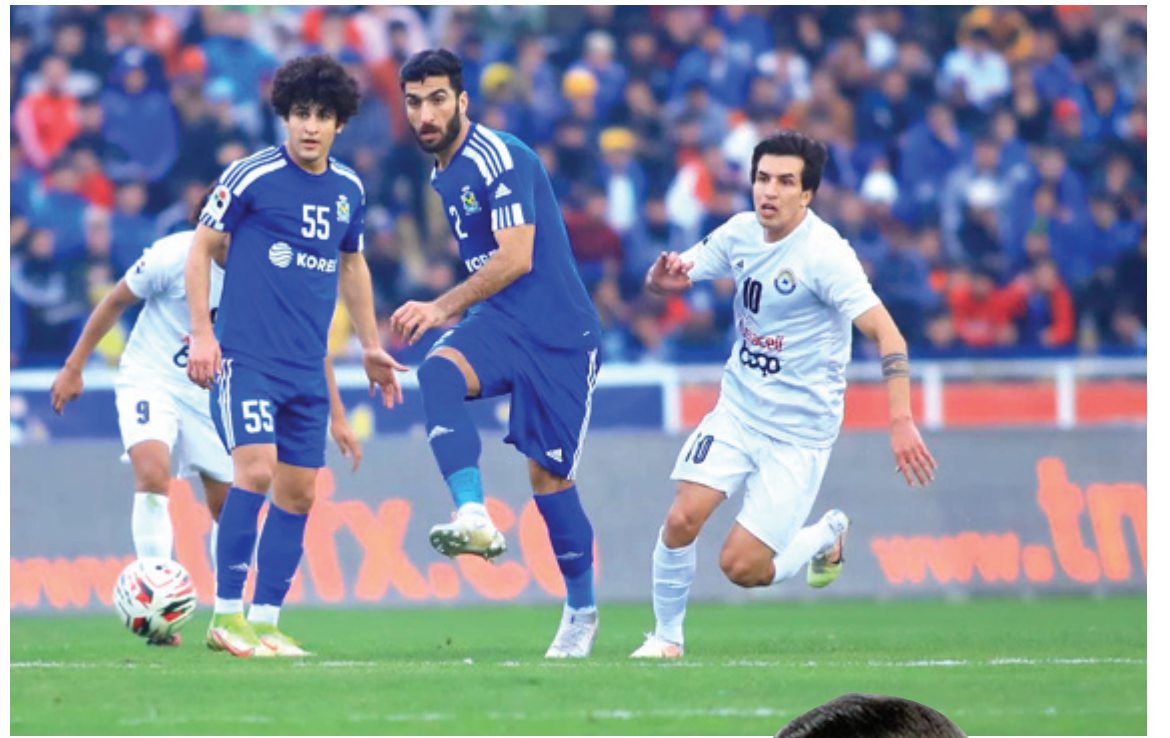
كلاسيكو: التعادل الايجابي يتسيد كلاسيكو العراق بين القوة الجوية والزوراء

بتعادلها بهدفين ليتقدم الابيض للوصافة مؤقتا 34 فيما استمر الازرق خامسا 33 ضمن الدور الثامن عشر الممتاز وزينها الحضور الجماهيري