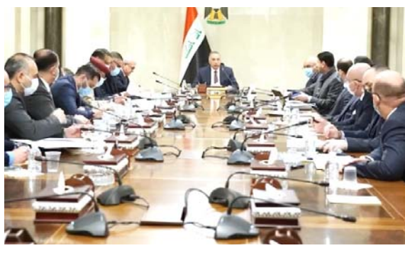
جلسة: رئيس الوزراء ترأس اجتماع اللجنة العليا للصحة والسلامة

تتعايش معه، ورغم انه لا يزال صحتي بغداد، يكون حسب التعليمات الصادرة من وزارتي التربية والصحة، وهما غير مشمولين بهذا الاعمام. عن شكوكها بشأن فعالية إعطاء جرعة رابعة من اللقاحات لعامة السكان، قائلة ان (الجرعات المتكررة ليست كافية لسد احتياجاتنا من اقراص كورونا ويمكن ان يضر صحتنا ويمكن للبشرية ان