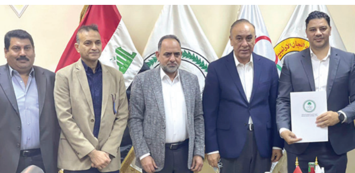
عقد: توقيع العقد من قبل اتحاد اليد مع المدرب المصري في اللجنة الأولمبية