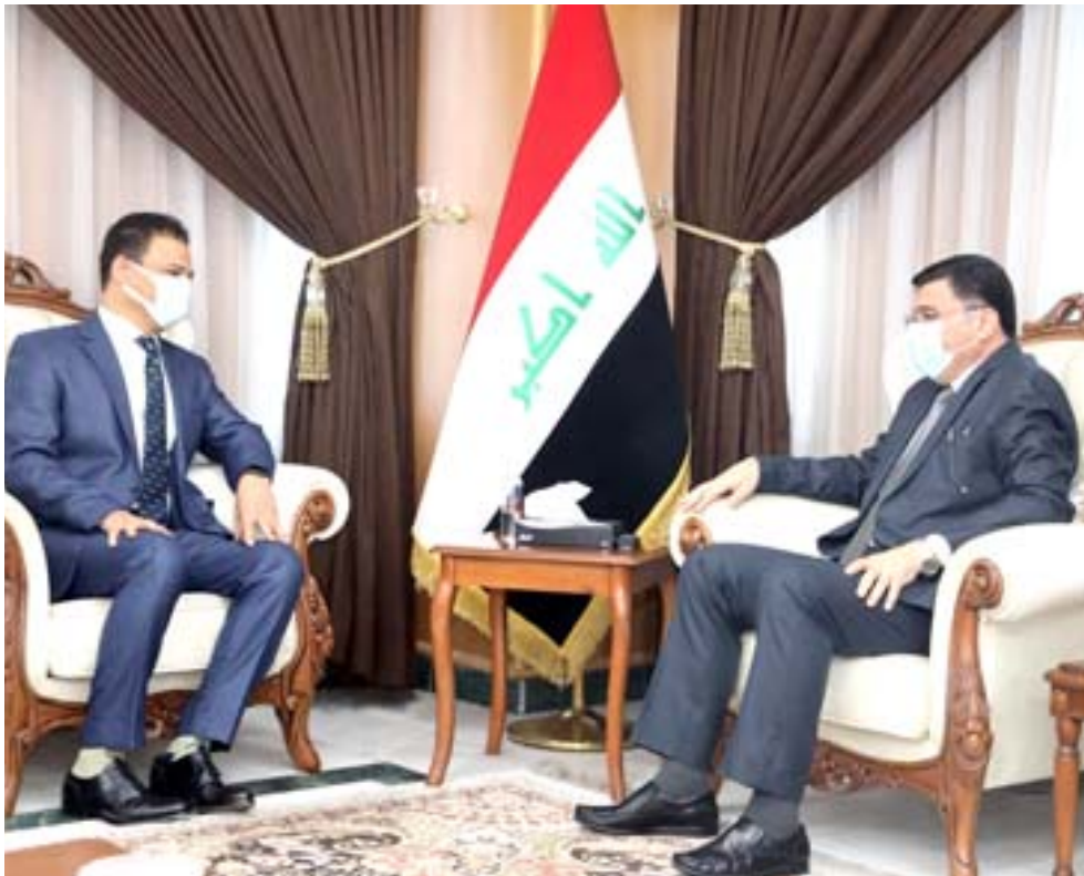
لقاء وزير الموارد يلتقي السفير المصري في بغداد ان (طسوح الوزارة الوصول الى ارقام واضحة ودقيقة بشأن تقاسم المياه بين العراق والسود

بغداد - الزمان أكدت الهيئة العامة للتقاعد التابعة لى وزارة المالية ، إنجاز نحو أربعة ملايين معاملة تقاعدية خلال الشهر الجاري، وقال بيان تلقته (الزمان) أمس ان (الهيئة) أكملت معاملات التحقق والتقاعدية التي شملت فئات المدني والعسكري وضحايا الارهاب وشهداء الجيش والحشد والشرطة والمصابين ، إضافة الى معاملات جهات المخابرات الوطني ومؤسستي الشهداء وقوى الأمن الداخلي و السجاء وغيرها من الفئات المشمولة). فيما استأنف مصرف الرشيد العمل باستقبال شراء سندات بناء ضمن الإصدارية الثانية من الجمهور. دعا المكتب الاعلامي للمصرف في بيان تلقته (الزمان) امس «الراغبين بالشراء الى مراجعة فروع المصرف في بغداد (المحافظات)، وأضاف ان التعليمات صادرة في 500 الف دينار وحددة قيمة السند كل سنة بحدثة 6 بالمئة تدفع للربون كل ستة اشهر وبلدة سنتين وسند بمبلغ مليون دينار بفائدة 7 بالمئة، تدفع كل ستة اشهر لمدة اربعة اعوام).