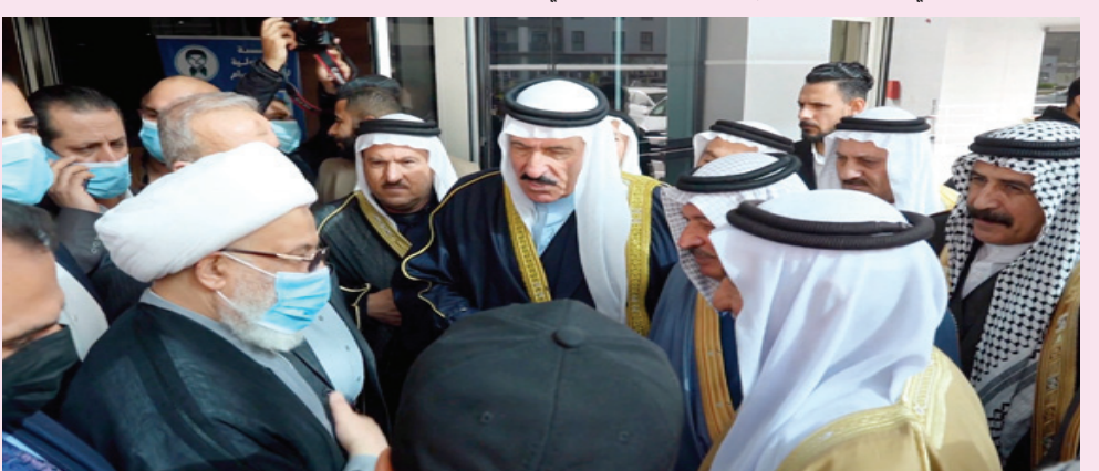
زهارة: وفد عشائر نينوى يزور العتبة الحسينية

واضاف الريبي، انه ( لم تبقى الا بعض التفاصيل الصغيرة لحسم