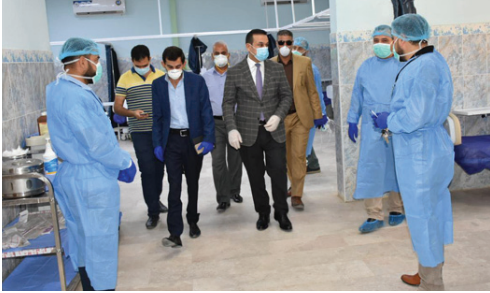
تفقد: مدير عام صحة الأنبار في جولة تفقدية مع مدير مركز أورام الأنبار

ما لمسناه من الإهتمام والحب والعطف والعناية المقدم له من قبل كل الكادر في المستشفى دونما كلل وإثعب .ومرة ثانية وهو يتقرب يومياته، وهو أحياناً يمر بأوقات عصيبة حينما يقف عاجزاً عن إنقاذ واحداً من مرضاه، ويتذكر كيف أن ابنته احتفلت به ذات مرة فقط لأنه أنشم في البيت بعد يوم شاق من العمل قضاء وسط مرضاه المصابين بسرطان!