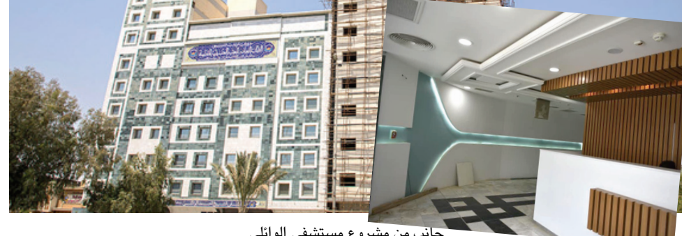
جانب من مشروع مستشفى الوائلي

المشآت الاخرى) حسب قوله. واعلن قسم محو الامية في المديرية العامة للتربية في كربلاء عن حصول موافقة وزارة التربية على المستشفيات حيث يضم 77 غرفة لرقود المرضى ويحتوي على 200 سرير بالإضافة الى صالة للمعاملات ومختبرات وعدد من