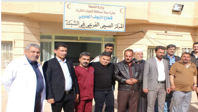
الملاكات الصحية في ناحية شبكة الحدودية

النجف - سعدون الجابري من أجل توفير الخدمات الصحية إلى جميع المواطنين ، ولاسيما في المناطق النائية والبعيدة عن مركز المحافظة وذات الخطورة العالية ، نفذت دائرة صحة المحافظة حملة صحية متكاملة في ناحية الشبكة الحدودية مع المملكة العربية السعودية 200 كم للجنوب عن مركز النجف .