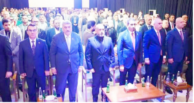
مؤتمراً: جانب من مؤتمر العمرة

وتطلعات المواطنين، للحصول على خدمات حكومية أكثر كفاءة وشفافية وسريعة . وذلك خلال مشاركته في المؤتمر الرسمي للإعلان عن تفعيل تطبيق هيئة خدمات بغداد، الذي أقيم في