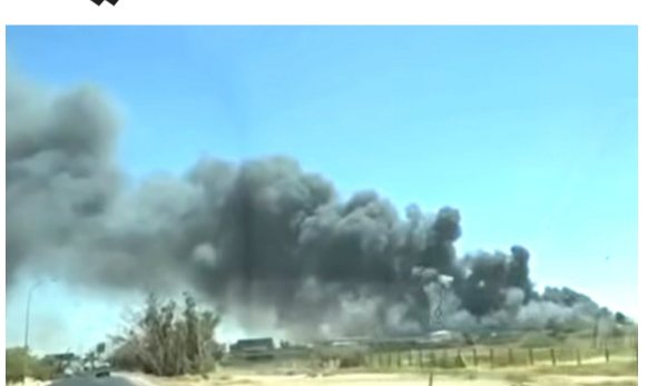
حريق : الدخان يتصاعد من موقع حريق مطار بغداد

التدريب، بعد من أبرز الملفات التي تستحق المراجعة). مينا إن (ملايين الدولارات صُرقت على المشروع طوال سنوات، في حين ما يزال المبنى غير مستغل بالشكل المطلوب، بينما تستمر الشركة بإيفاد الطيارين وأطقم الصيانة إلى خارج العراق للتدريب، بما يرتب كلفة مالية كبيرة). وأشار الجبوري إلى إن (ملف الورش الفنية يستوجب هو الآخر التحقيق). مسانداً عن (أسباب عدم تفعيل ورش صيانة الشركة والاعتماد على شركات وسيطة بدلاً من الشركات الأصلية، الأمر الذي أدى، بحسب وصفه، إلى استنزاف ملايين الدولارات من دون مبررات فنية مقنعة). وتابع إن (قسم التكوين، يمثل أحد الملفات التي ينبغي