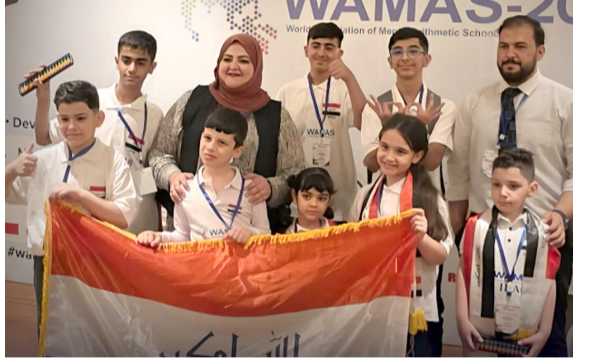
تتويج : تلاميذ العراق بالحساب الذهني يعتلون منصة التفوق

بغداد - ندى شوكت العلاقات بين العراق ودول الخليج كانت متميزة قبل الحروب، إلا أنها تأثرت لاحقاً ببعض الملفات، وإن الحكومة تعمل على ترميمها وتعزيزها. (حرص المجلس على مواصلة العمل المشترك مع العراق وتوسيع مجالات الشراكة والتكامل بما يدعم الأمن والاستقرار الإقليميين). وكان وزير الخارجية فؤاد حسين، قد أعلن في وقت سابق، إن العراق تسلم رسالة من قادة دول مجلس التعاون تدعو إلى فتح حوار جديد مع المجلس، وقال حسين عبر مشروع الربط مع الشبكة (الخليجية). من جانبه، قال البيدي إن (زيارته إلى بغداد جاءت لتهنئة رئيس مجلس الوزراء، والإشادة بالخطوات التي تتخذها الحكومة، فضلاً عن نقل رسالة من قادة دول الخليج البيدي إلى (العراق). وتابع إن (مجلس التعاون يضع أمن واستقرار المنطقة في مقدمة أولوياته، ويعد ركيزة أساسية لتحقيق التنمية، مشيداً بالإجراءات التي تتخذها الحكومة العراقية في هذا الإطار). ولفت إلى إن (دول المجلس تنتظر إلى العراق بوصفه شريكاً استراتيجياً، وإن استقراره يمثل مصلحة مشتركة لشعوب المنطقة).