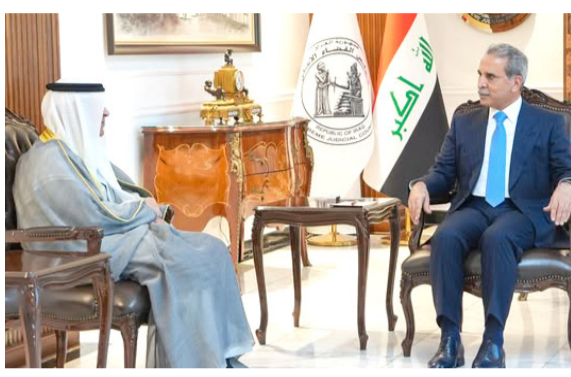
استقبال : رئيس مجلس القضاء، يستقبل وفد تعاون دول الخليج

بغداد - قصي منذر سلم الأمين العام لمجلس التعاون البيديوي، رسائل من رئاسة الحكومة والجمهورية والقضاء، تضمنت دعوات لفتح حوار جديد، وتوسيع مجالات التعاون والشراكة، وتعزيز التنسيق السياسي والأمني. فقد استقبل رئيس مجلس الوزراء على قاعة البيديوي، أمس الأربعاء، البيديوي والوفد العراقي، الذي نقل رسالة من قادة دول الخليج العربية، هنأوا فيها البيديوي على تولي رئاسة مجلس النواب وتشكيل الحكومة. كما استقبل في مختلف المجالات، بما يعزز مصالح الشراكة، ويديم أسس التنمية والازدهار، وشدد البيديوي على (حرص الحكومة في تعزيز العلاقات مع بلدان الخليج التي تشمل العمق العربي للعراق، مؤكداً أن العراق سيشهد مرحلة جديدة تستند إلى أسس بناء الدولة الصاعدة بسيادة كاملة واقتصاد متين ومستقل للناظر، واحترام العلاقات وتمتينها