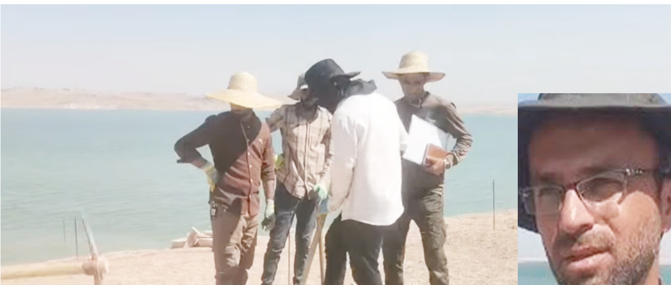
موقع: مهندسون يعملون في موقع المتنزه دهبوك