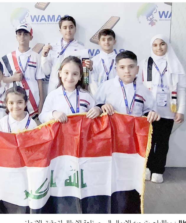
إبطال: مطالبات بتوجيه الأموال الى صناعة الأبطال لتحقيق الإنجاز

الجنف- نجم عبد كريد في الوقت الذي تتشغل فيه ذاكرة العراقيين هذه الأيام بمشاهد مؤلمة لهدر الأموال العامة وتلك المدفونة تحت الأرض وإحراق ملايين الدولارات في النور، وما رافق ذلك من احتراق لقلوب أبناء هذا الشعب الذين ما زالوا ينتظرون حلولاً حقيقية لأزمات الكهرباء والخدمات، هناك في مدينة الإسماعيلية المصرية كانت صورة أخرى ترسم للعراق... صورة مشرقة عنوانها الإنجاز والعطاء والوفاء للوطن. ففي أرض الكنانة، لم يكن مملو العراق يحملون معهم سوى أحلامهم وإصرارهم وعشقهم لرابية بلادهم. وهناك ارتفعت الاعلام العراقية وغزف السلام