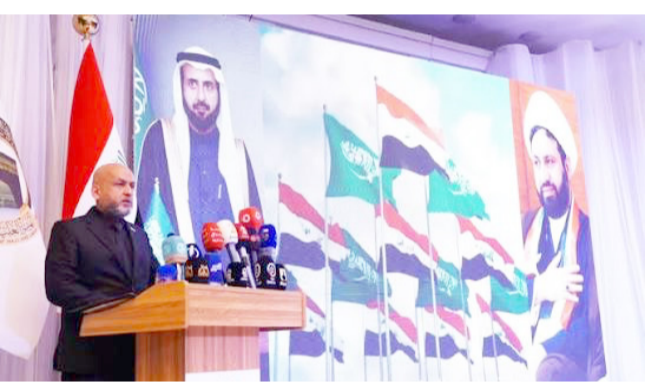
مؤتمراً: جانب من مؤتمر العمرة

وأضاف البيان أن (تنظيم النسخة الرابعة يأتي في إطار تعزيز العلاقات العراقية السعودية، ودعم التعاون بين القطاعين العام والخاص، بما يسهم في الإرتقاء بقطاع العمرة، وفتح آفاق جديدة للشراكات والاستثمارات التي جانب إيجاد خدمات تتناسب مع تطلعات المعتمرين . وتواكب التطورات المتسارعة في هذا المجال) . وأكد امين بغداد، عمار موسى . أن التحول الرقمي أصبح ضرورة تفرضها متطلبات التنمية الحديثة