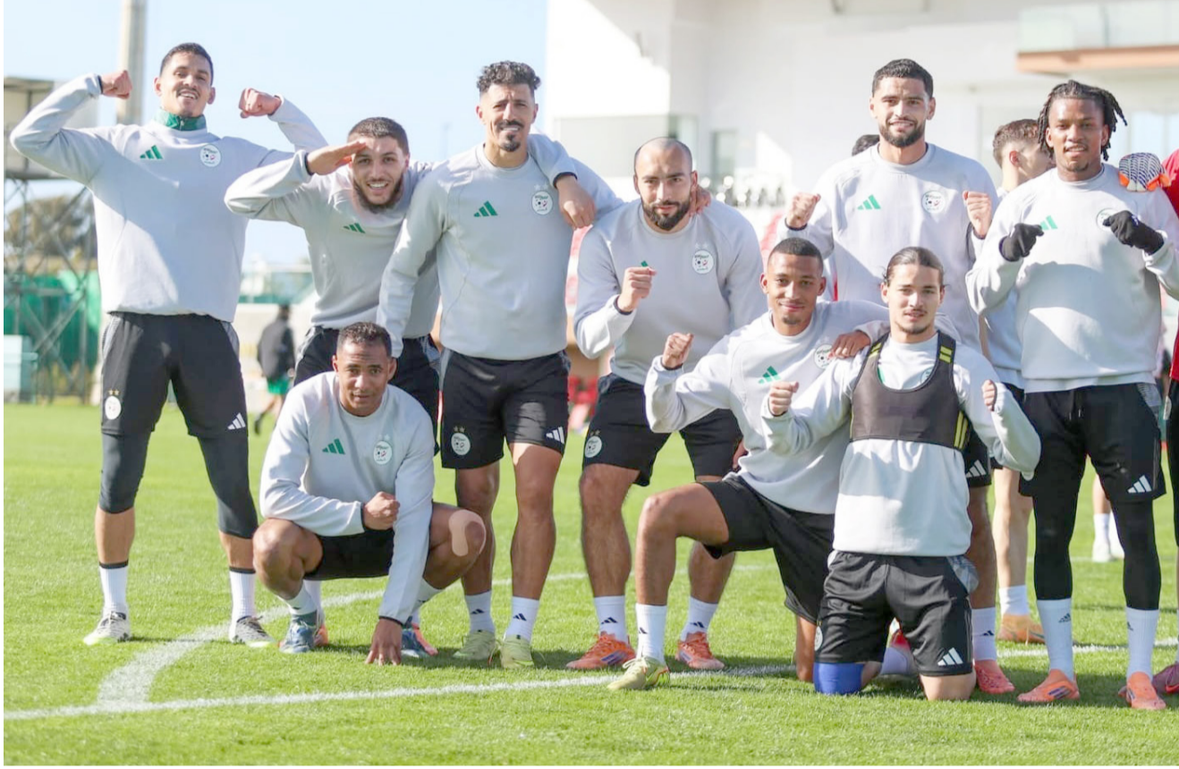
تدريبات. منتخب الجزائر يجري تدريباته استعداداً لمواجهة نظيره السويسري

والتحكم في الأمور وفرض السيطرة من البداية سيما وأنه منتخب منظم كما ظهر في مبارياته الأولى وفيها خطف الأنظار وازدادت اسل جهوره في قدرة لاعبي الفريق على قلب النتيجة الفريق بعد البداية المثالية التي منحت الفريق التوازن بالثقة ومعرفة طريق الفوز الذي ينتظر أن يأخذه الى الدور القادم نقطة التحول التي مشاركت الفريق في ظل يمر في أفضل فتراته مدعوماً بروح دفاعون الذين استمروا يدافعون عن الشان الفريق ودعم خطوط اللعب حيث الدفاع الصلب كما عمل خط الوسط على خلق التوازن في الوقت يتمتع الهجوم ممثل صلاح عليها لاعبو الفريق الذين قدموا الفريق بأفضل طريقة وارتفاع سقف طموحاته في تقديم مواجهة الجمعة بالتعويل على جهود اللاعبين في تقديم الأداء المطلوب وامتلاك فرصة الفوز بقيادة حسام حسن الذي يريد صنع التاريخ الشخصي ويمتدح عندما يواجه منتخب يتمتع بالقوة ومع بنديا ويتعين على منتخب مصر استغلال الفرصة بأفضل طريقة من خلال اللعب بنديا وقوة وان يكون المنتخب على قدر التطلعات