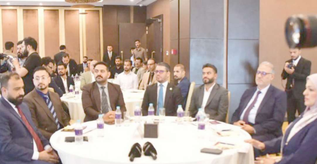
دورة: مشاركون في الدورة الأكاديمية

على صعيد متصل . أطلق المعهد التقني الرميثة، التابع إلى الجامعة، دورة