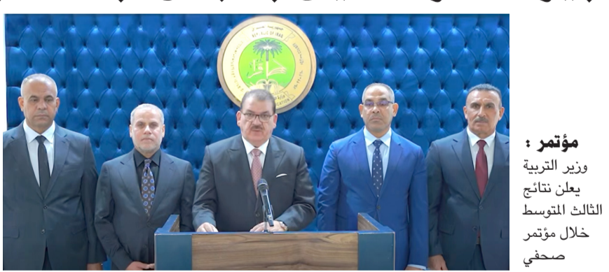
مؤتمر : وزير التربية يعلن نتائج الثالث المتوسط خلال مؤتمر صحفي

بغداد - ابتهاج العربي عاشت الأسر العراقية، أجواءً من الفرح والارتياح بعد إعلان نتائج امتحانات الصف الثالث المتوسط للدراسيين، وإعلانها مع معدلات مرتفعة وعدد كبير من الطلبة، فيما أعلنت وزارة التربية والتعليم العالي، حزمة من القرارات الداعمة للطلبة، شملت منح فرص إضافية للراسبين، وإقرار خمس درجات لمعالجة الحالات الحرجة. وقال أولياء الطلبة أمس إن (فرحتهم لم تقتصر على إعلان النجاح، وإنما شملت الشعور بانتهاء مرحلة من القلق والتربص راقت أبنائهم طوال فترة الامتحانات). مؤكداً إن (المناسبة والجهود كانت وراء النتائج التي تحققت). معربين عن (سعادتهم بحصد أبنائهم ثمار جهودهم، وإشاوروا إلى (دهم لابنائهم أسهم