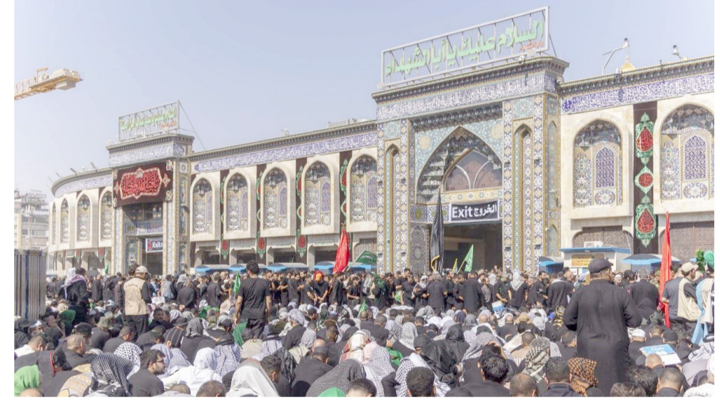
زوار: حشود الزائرين تحيط بالروضة الحسينية

عبر نشر 81 محطة متنقلة، وإضافة 308 برجاً ثابتاً، فضلاً عن تشغيل أكثر من 7 آلاف خلية اتصالات، وذلك أسهم في الحفاظ على استقرار الخدمات رغم الارتفاع الكبير في معدلات الاستخدام). احتياجات زوار من جهته نجحت وزارة الموارد المائية، في تأمين احتياجات زوار محرم -متابعة وزيرها منى التميمي. وقال بيان تلقتّه (الزمان) أمس ان (الوزارة شكلت فرقة مخصصة للإشراف على الجهد الخدمي الخاص قبل الزيارة، لتابعة تنفيذ الخطة الميدانية