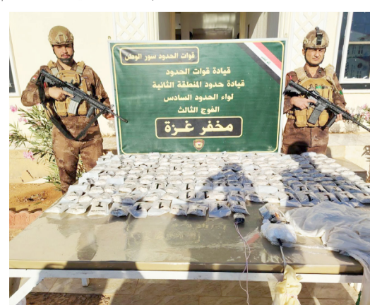
تدريب: قوات أمنية تحيط تهريب مخدرات بواسطة بالون