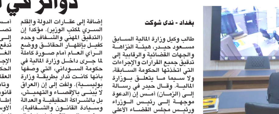
متابعة: وزير التربية يتابع سير الامتحانات الطلبة عبر شاشة الكرونية

بغداد - ساري تحسين أكدت وزارة التربية، إعلان نتائج الثالث المتوسط سيكون خلال هذا الأسبوع الجاري فور اكتمال عمليات المراجعة والتدقيق التي ما تزال مستمرة. وقالت الوزارة في بيان تلقته (الزمن) أمس إن (نتائج امتحانات الثالث المتوسط ما تزال قيد التدقيق، ومن المقرر إعلانها خلال الأسبوع التالي بعد استكمال الإجراءات الفنية الخاصة بها). من جانبه، كشف الوزير عبد الكريم عطبان الجبوري، عن منظومة المراقبة الإلكترونية الذكية ستسهم في تعزيز نزاهة الامتحانات وجماعتها من أي خروقات، وأوضح البيان إن (الجبوري تابع من غرفة