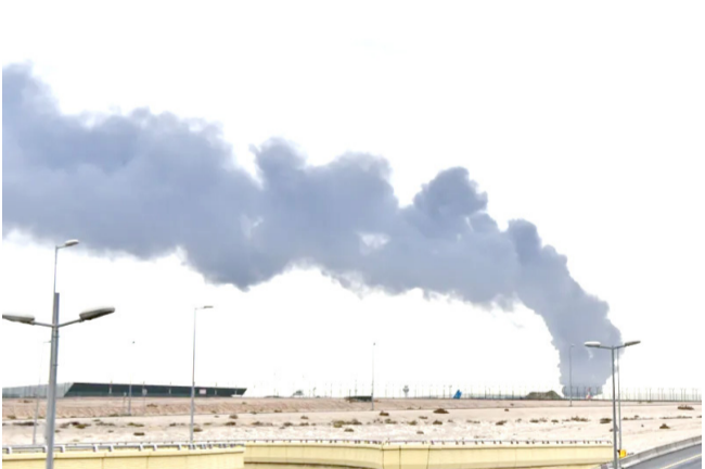
ناقلة: دخان متصاعد من الناقله المحترقة

الكويت (الكويت)، (ا ف ب) - دانته الكويت امس الأحد، الاتهامات الصارخ لسيادتها، بعد الضربات الأخيرة التي إيران فجرا على أراضيها، مؤكدة أنها تتنقل «نقوصاً» للمساعدات الإنسانية لوضع حد نهائي للحرب في الشرق الأوسط. وقالت وزارة الخارجية الكويتية «تتكرر الاعتداءات الإيرانية الأثمة على دولة الكويت، والتي كان آخرها فجر اليوم، وذلك بعدما أعلن الجيش النضدي «هجمات صاروخية وطائرات مسيرة معادية»، فيما أكد الحرس الثوري الإيراني شنن ضربات على الكويت والبحرين ردا على هجمات اميركية طالت الأراضي الإيرانية.