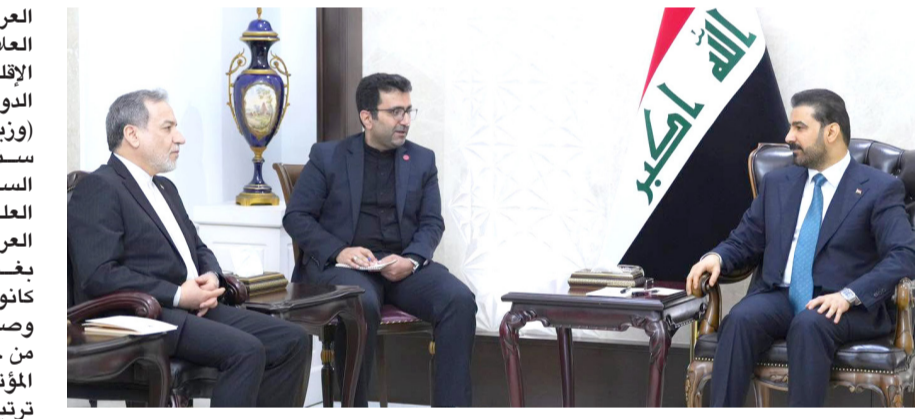
استقبال: رئيس الوزراء يستقبل وزير الخارجية الإيراني

بغداد - أي ترتيبات خارج التفاهات ستزيد التوترات في هرمز العراق يعلن إستعداده لإحتضان مباحثات بين إيران ودول الخليج