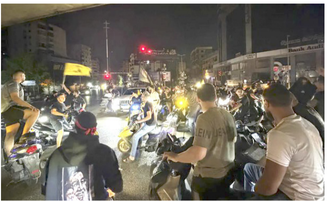
تظاهرات، عناصر حزب الله ينتشرون في شوارع بيروت

وأورد البيان أن عون تمنى في حديثه مع ترامب أن «تساهم الولايات المتحدة في منع أي خرق لهذا الاتفاق وتأمين الوفاء بكل الاتفاقات التي تم التفاوض عليها»، وأضاف الضغوط على إسرائيل لانسحاب من الأراضي المحتلةها في الجنوب لتسهيل انتشار الجيش حتى الحدود الدولية». ووفقا للاتفاق الذي نشرت وزارة الخارجية الأميركية نضه ليل الجمعة السبت، فإن إسرائيل ولبنان يعلنان بينهما إنهاء الصراع بشكل نهائي، ومعالجة أسبابه الجهرية، وبالتالي، إنهاء أي حالة حرب بينهما رسميا. ويضع الاتفاق اليد لبيسط الجيش اللبناني "سلطته السيادية على كامل الأراضي اللبنانية" بينما يتم "التحقق من نزع سلاح الجماعات المسلحة غير الحكومية، وتحديد حزب الله ولكن وزير الدفاع الإسرائيلي يسرائيل كاتس قال السبت إنه أوع وتنازهاه «إلى الجيش مريعة، وخطة كبرى بالخلى عن السيطرة للحدود الإسرائيلية، معتبرا أن السلطة تشترع بقاء الإحتلال إلى سنوات طويلة وقد تصل إلى ضم هذه الأراضي إلى الكيان الصهيوني، لكن الرئيس اللبناني جوزاف عون أكد السبت خلال اتصال تلقاه من الرئيس الأميركي دونالد ترامب، أن الدولة ستحتل مسؤولية تطبيق اتفاق الإطار، وفق بيان صادر عن الرئاسة اللبنانية.