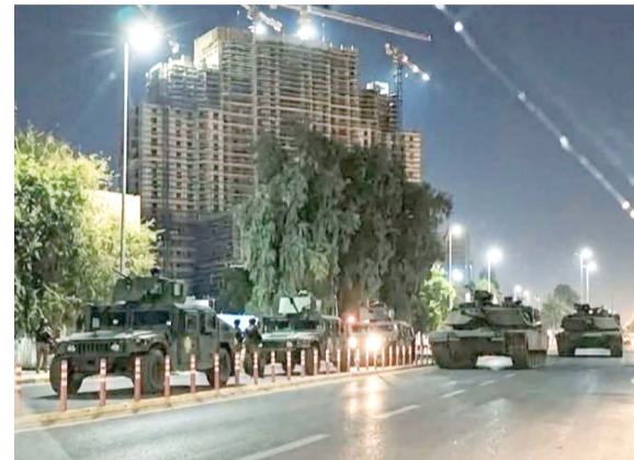
حملة: البات مكافحة الإرهاب خلال حملة الاعتقالات

بغداد - قصي منذر عاشت المنطقة الخضراء ساعات من التوتر والرهبة، بعدما تحولت شوارعها وساحاتها إلى نكتة عسكرية، وسط انتشار كثيف للديابات والمدربات وقوات مكافحة الإرهاب، بالتعاون مع اعتقال أكثر من 47 نائباً ومسؤولاً، قبل إن رئيس كتلة سياسية بارزة كان من بينهم، وقالت هيئة النزاهة الاتحادية في بيان تلقته (الزمن) أمس إنها (باشرت بتنفيذ أوامر القبض القضائية بحق عدد من المتهمين بفضايات تتعلق بالمال العام، في إطار جهودها الرامية لمكافحة الفساد واسترداد الحقوق العامة). وأضافت إن (هذا الإنجاز جاء ثمرة لتضافر الجهود المشتركة والتكاملية بين السلطات القضائية والتنفيذية والتشريعية، إلى جانب جهود الهيئة، والتي أفضت بشكل مباشر إلى تنفيذ تلك الأوامر، بعد عمليات متتابعة وتدقيق ومراقبة دووية ومستمرة). مؤكدة إن (جميع إجراءاتها تجري بدقة وفق أحكام القانون وتحت مظلة)، وأشارت جملة الإجراءات التي طالت عدداً من المسؤولين أكثر المواقع الموقوفة في بغداد (المنطقة الخضراء)، تفاعلاً شعبياً واسعاً، بعد تشهيقها حملة (الإبادة النظيف) التي اسفطت نظاماً كاملاً من الرشا والفساد في إيطاليا في تسعينيات القرن الماضي. كما أظهرت مقاطع فيديو جرى تداولها عبر مواقع التواصل الاجتماعي (انتشار قوات أمنية تستخدم البات ثقيلة، بينها ديابات، داخل المنطقة الخضراء، إلى جانب مشاهد لانتشار عناصر أمنية داخل مجمع سكني واحد (المنزل)، فيما أفضت مصادر أمنية بيان (عمليات الداهم طالت عدداً من الشخصيات المتهمه بالفساد، ونفذت باوامر