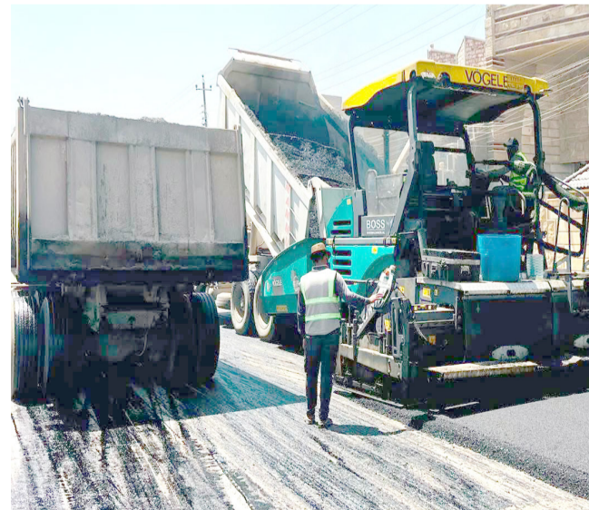
تبليط: ملاكات امانة بغداد تقوم بتبليط شارع الكتيبة

بيان تلقته (الزمان) أن (الأعمال الحالية تأتي استكمالاً لشارع سابعة نفذتها المحافظة في منطقة الفضيلية، وتعد انطلاقاً جديدة لتعزيز المشاريع الخدمية والتنمية بما يلبي احتياجات السكان).