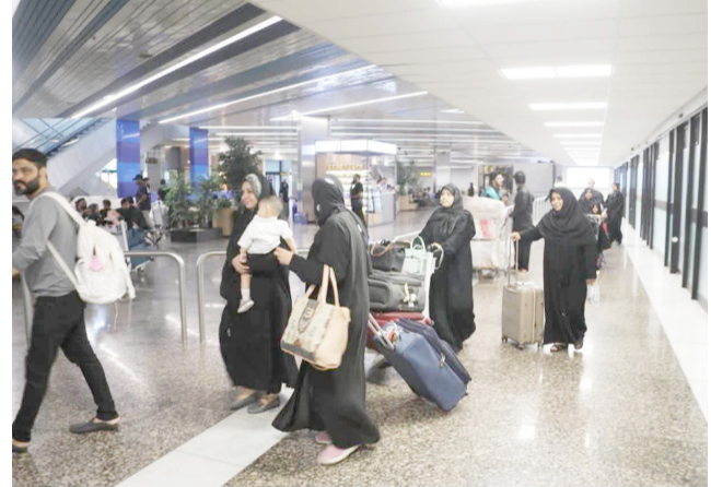
إحياء : زوار قادمين من مختلف الدول للمشاركة بإحياء عاشوراء في مدينة كربلاء