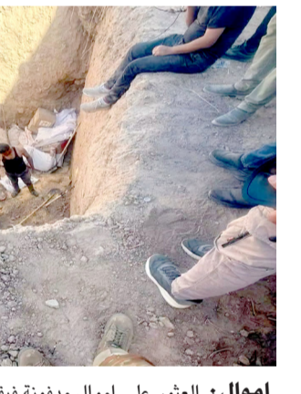
أموال: العثور على أموال مدفونة فيقباء، بجي

شاحنة مع الجزء التخصصي الخاص بها، والبالغة قيمته 462 مليار دينار، لحين استكمال التحقيقات الجارية بشأن هذه جهة أخرى، نفذت هيئة النزاهة الاتحادية، أربع عمليات ضبط في عدد من دوائر محافظة ذي قار، أسفرت عن ضبط 12 مئمةا بينهم موظفان، لقيامهم بجسارة معاملات وإجراهما خلفاً للقانون. وقالت الهيئة المتحصلة في القضية، التي (فرقها مؤلفاً في مكتب تحقيق ذي قار انتقل إلى مديريات بلدية الناصرية والضريبة والتسجيل العقاري الثانية، وتمكن من ضبط موظفين اثنين في بلدية الناصرية على خلفية قيامها بتمشية