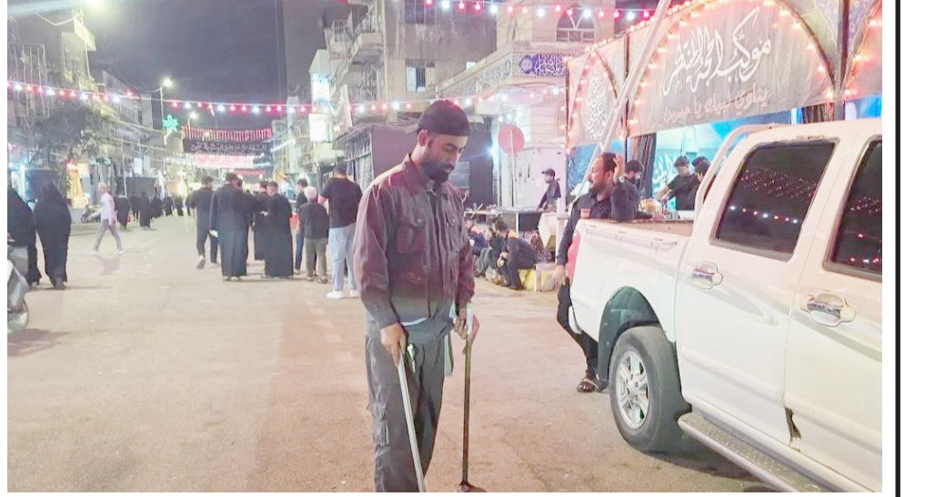
استعدادات : عمليات تنظيف شوارع كربلاء مستمرة بواسطة المتطوعين

كربلاء - محمد فاضل ظاهر أكملت الدوائر الخدمية في محافظة كربلاء، استعداداتها الخاصة بزيارة عاشوراء، وفق خطط ميدانية وخدمية وصحية متكاملة، بهدف توفير أفضل الخدمات للزائرات الوافدين لإحياء هذه المناسبة الاليمية. وقال مسؤول إعلام مديرية بلدية كربلاء، محمد الموسوي، في تصريح أمس إن (البلدية أعدت