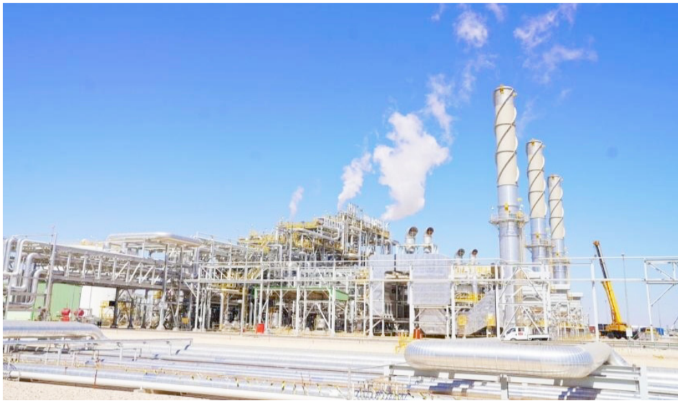
مصفى : إحياء مشروع إنشاء مصفى الوند

لبدء زراعة الحنطة ، إن (حملة تسويق محصول الحنطة للموسم الحالي إلى مراكز وزارة التجارة في ديالى، ولا سيما سايلو بعقوبة، انتهت بعد أكثر من ستة أسابيع من إنطلاقها). خطوة زراعية وأضاف أن (إجمالي ما تم تسويقه تجاوز 152,000 طن)، مبينا أن (الإنتاج الحالي أقل من الموسم الماضي نتيجة تقليص الخطة الزراعية بنسبة تتجاوز 50 بالمئة