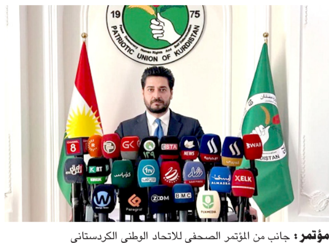
مؤتمراً، جانب من المؤتمر الصحفي للاتحاد الوطني الكردستاني