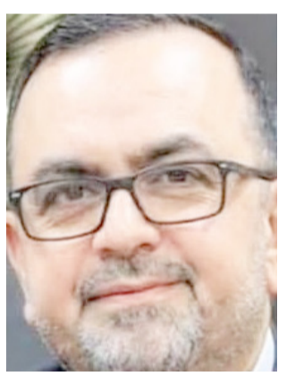
عبد الحسين الموسوي

وزير الصحة الجديد: إقرار بالتقصير وعود بالصرف من جانبه، لم يخف وزير الصحة الدكتور عبد الحسين الموسوي، الذي تسلم مهام منصبه في 15 أيار 2026، حجم الأزمة، واصفاً أوضاع الوزارة بأنها تمر بظروف صعبة، مؤكداً انه يسعى مع كوارده لمعالجة التحديات