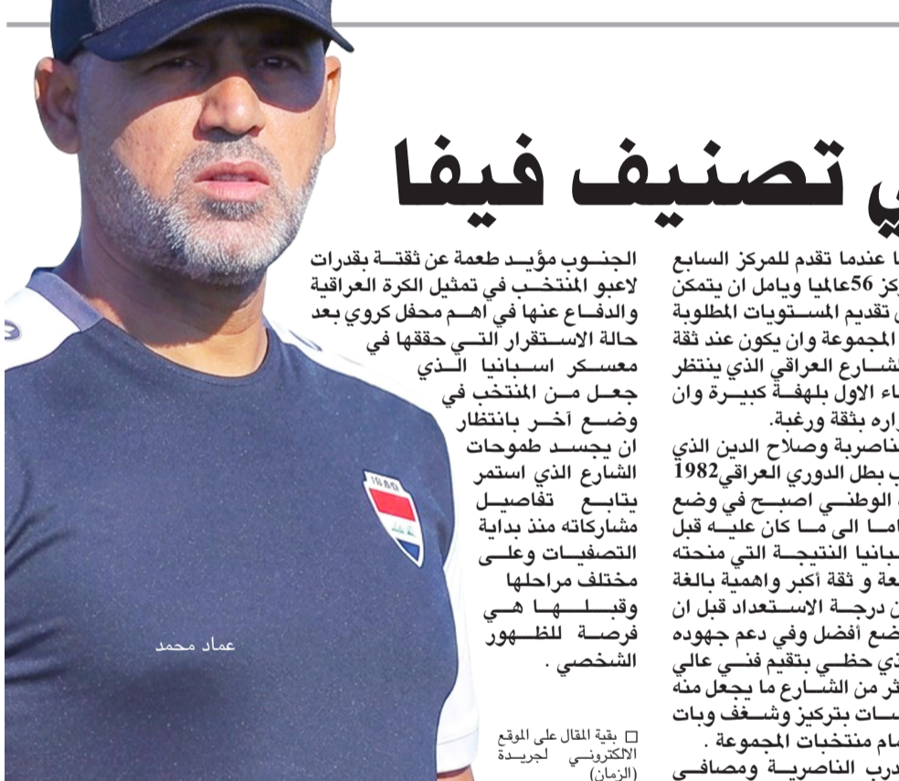
بقية المقال على الموقع الالكتروني لجريدة (الزمان)

الفرق من نجومه الكبار فهي تأخذ بنظر الاعتبار الدور القيادي للاعبين باعتبارها مدبر آخر داخل الساحة - كما وصف سابقاً - كذا يتم تقييم أخلاقه العامة داخل وخارج الملعب وسلوكه مع زملائه وفي المباريات ومدى قدرته على التعاطي مع وسائل الاعلام وفرض احترامه على غرفة الملابس (بمستحدث الاصطلاح الأخير) وغير ذلك من صفات كانت جلية على لاعبين كبار من قبيل (بكتاور الالمانى وكرويف الهولندي وباسرلا الأرجنتيني ودينا زوف الايطالي وسقراط البرازيلي ورعد حمودي العراقي) ..