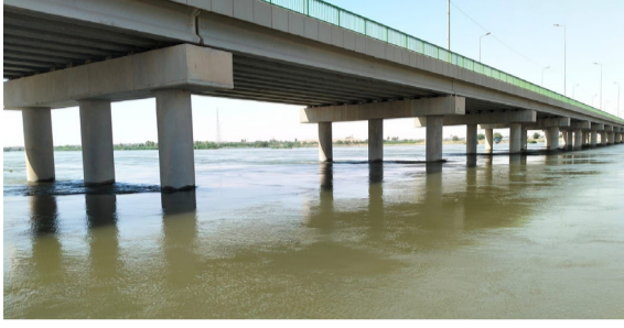
منسوب : ارتفاع واضح في منسوب نهر الفرات في القائم

بمقدار 2.29 دولار، ليغلق عند 69.28 دولاراً للبرميل، متراجعا يومياً بنسبة 3.20 بالمئة، إلا إنه حقق على أساس أسبوعي مكاسب بلغت 3.21 دولارات، أي ما يعادل 4.63 بالمئة من قيمته مقارنة ببداية الأسبوع. مؤكداً إن (خام البصرة المتوسط تراجع بمقدار 2.29 دولار أيضاً، ليستقر عند 71.38 دولاراً للبرميل بانخفاض يومي نسبته 3.11 بالمئة، لكنه سجل مكاسب أسبوعية بلغت 4.71 دولارات، بما يعادل 6.71 بالمئة). إلى ذلك، أنهى خام