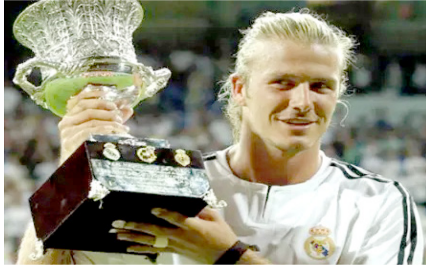
ديفيد بيكهام يرفع كأسه بعد الفوز ببطولة كأس العالم لكرة القدم.

□ لوس انجليس (ف ب) - سيمتج نجم كرة القدم الإنجليزية السابق ديفيد بيكهام نجمة في ممشى المشاهير بهوليوود، وذلك بالتزامن مع استعداد الولايات المتحدة لاستضافة نهائيات كأس العالم. ومن المقرر أن يحضر حفل التكريم الذي سيقام في 12 حزيران كل من الممثل الشهير توم كرون، وزوجة اللاعب، المغنية الفرنسية والمصممة الأزياء فيكتوريا بيكهام، حيث سيتم تكريم قائد المنتخب الإنجليزي السابق على أحد أشهر المعالم في هوليوود، وسيقام التكريم لبيكهام 51 عاماً قبل ساعات من انطلاق أول مباراة تقام على الأراضي الأميركية ضمن النسخة الحالية من كأس العالم، التي تستضيفها بشكل مشترك كل من الولايات المتحدة والمكسيك وكندا، وقالت أنا مارتنين من غرفة تجارة هوليبود إن «تكريم ديفيد بيكهام بنجمة في قبة الترفيه الرياضي يأتي في توقيت مناسب مع استعداد الولايات المتحدة لاستضافة كأس العالم». وأضافت إن دور بيكهام في رفع شعبية كرة القدم في أميركا، وتأثيره المستمر في الرياضة والثقافة العالمية، يجعل هذا التكريم ذا أهمية خاصة. والخبر ما سببه من إعجاب لبيكهام لأندية مانشستر يونايتد وبرشلونة الإسباني وميلان الإيطالي وباريس سان جرمان.