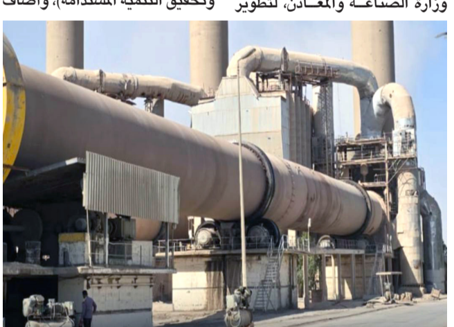
مباشرة: سمنت الكوفة يباشر بالإنتاج لتعزيز الصناعة العراقية

القطاع المحلي، ورفع كفاءة المعامل الإنتاجية، بما يسهم في زيادة معدلات إنتاج مادة السمنت، وتلبية الطلب المتزايد عليها في مشاريع البناء والإعمار)، مشيرة الى أن (ذلك يمثل خطوة مهمة نحو تعزيز الاعتماد على المنتج الوطني وتقليل الحاجة إلى الاستيراد، فضلا عن دعم النشاط الاقتصادي وتوفير فرص العمل، بما ينسجم مع خطط الوزارة للنهوض بالقطاع الصناعي وتحقيق التنمية المستدامة). وأضاف مباشرة: سمنت الكوفة يباشر بالإنتاج لتعزيز الصناعة العراقية