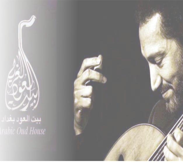
فنون: دار الوالي يحتفي بضيافة بيت العود وجانب من لقاء لبحث مشروع مهرجان العراق