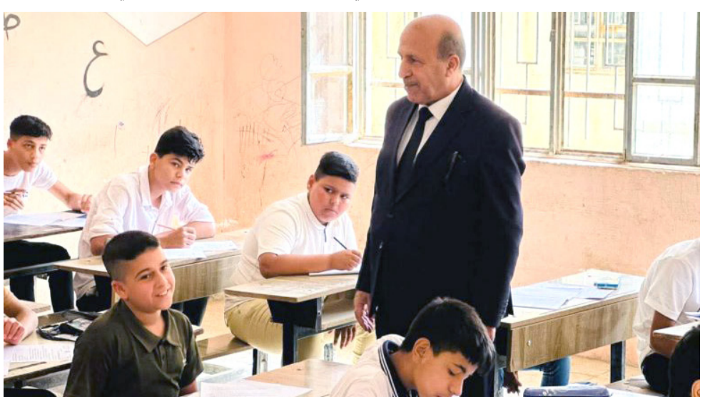
امتحان: قاعة إمتحانية في كربلاء

وقال الخطابي في تصريح تابعته (الزمان) امس ان (الشراكة مع القطاع الخاص والمؤسسات الاقتصادية تمثل عاملا مهما لنقد عجلة التنمية، وتنشيط الحركة التجارية ودعم الاقتصاد المحلي، فضلا عن توفير فرص العمل)، مبيّنا ان (المقومات الاقتصادية التي تمتلكها المحافظة،