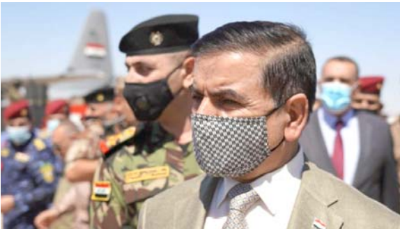
وصول وزير الدفاع يصل كربلاء للإطلاع على أمن الأربعينية