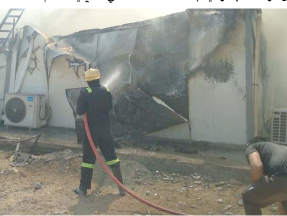
أخماد: فرق الدفاع المدني تخمد حريقاً في معمل سميت ميسان

على تقرير خبير الأدلة الجنائية لتحديد أسباب اندلاع الحريق، بادئ الأمر داخل مختبرات فحص مديرية الاستخبارات العسكرية وكذا العناصر تنظيم داعش في محافظة الأنبار، وقالت المديرية في بيان، أمس إنه ضمن مهامها لتعقب وبلاحة قتل داعش الإرهابي والوصول إلى أوكارهم، واستناداً إلى معلومات دقيقة لشعبة استخبارات الفرقة الخامسة احد فواصل مديرية الاستخبارات العسكرية في وزارة الدفاع، وبالتعاون مع الفوج الرابع لواء المشاة ٢٠، تمت مصادمة احد اوكار الارهاب الداعشي الذي يستخدم منطلقاً