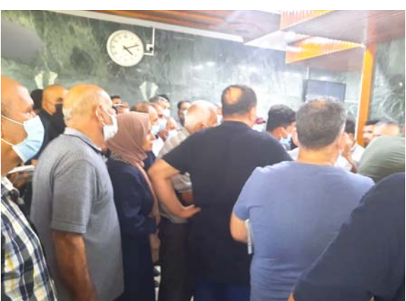
توزيع: إزدحام يفرق ضوابط الاحتران في دار التمريض الخاص

إصدار البطاقة الدولية الخاصة بالسفر خارج العراق، وأضاف العزراوي أن (على المراجع جلب نسخة من الجواز وكارت التلقيح، مبدئياً أن قيمة رسوم البطاقة التي حددتها وزارة الصحة مسبقاً للمواطن العراقي بقيمة 30 ألف دينار). وارتفع عدد الإصابات بفيروس كورونا من جديد مسجلاً 2515 إصابة بإصابة واضح عن موقف يوم السبت، وكشفت الموقف الوبائي اليومي التي تصدره وزارة الصحة عن تسجيل 47 حالة وفاة وزيادة طفيفة عن اليوم السابق، فيما سجلت الوزارة تماثل 5067 شخصاً إلى الشفاء، وكان الموقف قد سجل السبت 1959 إصابة فقط وسجلت الوزارة انخفاضاً كبيراً بأعداد المراجعين إلى مستشفياتها من الملحقين المسجلين بالوباء بسبب أعراضهم الخفيفة، بنسبة وصلت إلى أرباب، بينما تخطت للوصول إلى 16 مليون ملحق حتى نهاية العام الجاري لتفاذر تأثيرات الموجة الرابعة للوباء.