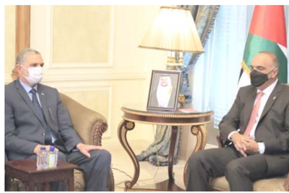
استقبال: رئيس الوزراء الأردني يستقبل وزير الداخلية العراقي أمس