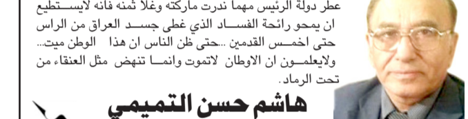
هاشم حسن التميمي