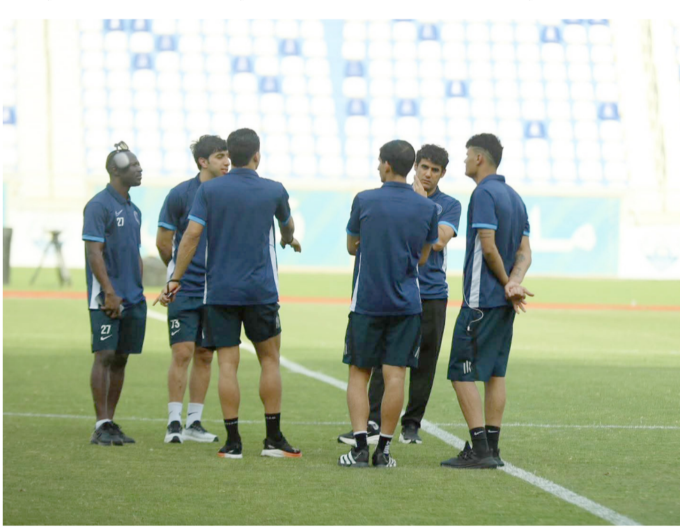
تدريبات: فريق الطلبة يجري تدريباته استعدادا لمواجهة دوري النجوم

الناصري- باسم الكوازي كل شيء انتهى في دوري نجوم العراق لكرة القدم بعد توزيع الجوائز للقب 86 نقطة وحبوط فريقي النخبة والقاسم للدرجة المتأخرة في وقت احتل الأمانة المركز الثامن عشر وسيخوض ملحق بلادي اوف امام فريق كربلاء الذي تغلب على الحدود بهدف في ملحق الدوري الممتاز امس الاول المواجهة التي سيحدد موعدا في وقت لاحق وستكون الأخيرة في الموسم وعلى ضوء نتيجتها يتم تسمية الفريق العشرين لدوري النجوم للموسم المقبل كما تعرفت اغلب الفرق على مراكزها في جدول الترتيب الفرقي باستثناء تغيرات محدودة قد تحدث تغيرا على بعض المركز على ضوء ما تسفر عنه مباريات الجولة الأخيرة التي تشهد اقامة خمس مباريات اليوم ومثلها يوم غد الثلاثاء وعندما تتكتم مسابقة الدوري الذي مهم جدا ان يشهد الدوري وبقية المسابقات تقوينا من قبل اتحاد الكرة ولجنة المسابقات فيما يتعلق بعملية التنظيم وتحديد مواعيد المباريات لتصحيح الأخطاء ودعم الإيجابيات التي راقت المباريات من جميع الجوانب والأهم ان يخضع الدوري الى موعد افتتاح واختتام ثابتين ثابت أسوة بدوريات المتقلبة ولا يباس ان يتم اللقاء بممظلي فرق دوري النجوم والممتاز والصحافة والإعلام للمشاركة في عملية التقويم لكي يتحمل الجميع مسؤولية اقامة وتنظيم الدوري .