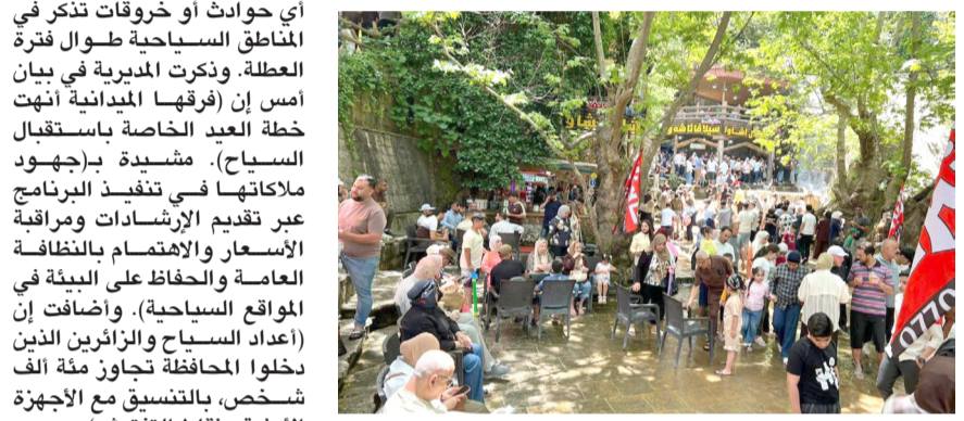
سياحة : مواطنون من الوسط والجنوب في سياحة بكرديستان