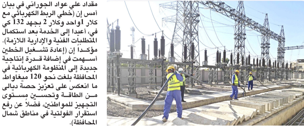
محطات: عمال يقومون بصيانة محطات توليد الكهرباء

مقداد علي عواد الجوراني في بيان امس (إن خطي الربط الكهربائي مع كلار أواحد وكلا 2 بجهد 132 ك. في أعيد إلى الخدمة بعد استكمال الصيانة والإدارة اللازمة). مؤكداً (إن إعادة تشغيل الخطين ساهمت في إضافة قدرة إنتاجية جديدة إلى المنظومة الكهربائية في المحافظة بلغت نحو 120 ميغواط، ما انعكس على تعزيز حصّة ديالى من الطاقة وتحسين مستوى التجهيز للمواطنين، فضلاً عن رفع استقرار الفولتية في مناطق شمال المحافظة). دمع ومتابعة وشدد على القول (إن هذا الإنجاز جاء بدعم ومتابعة مباشرة من الوزير على سعد وهيب، إلى جانب المبادرة الفعالة والإدارية من قبل الإدارة العامة للشركة العامة لتوزيع كهرباء الوسط). ولفت إلى (إن تشغيل خطي الربط ساهم أيضاً في تخفيف الاختناقات من محطة ديالى التحويلية 400 ك. في ما وفر مرونة تشغيلية أكبر للمنظومة وأتاح تحسين ساعات التجهيز ورفع موثوقية الشبكة في عموم المحافظة). ووجد تأكيداً (إن الخطوة تأتي ضمن برامج الوزارة الرامية إلى دعم استقرار المنظومة الكهربائية ومواكبة تزايد الطلب على الطاقة الكهربائية وتحسين مستوى الخدمة المقدمة للمواطنين).