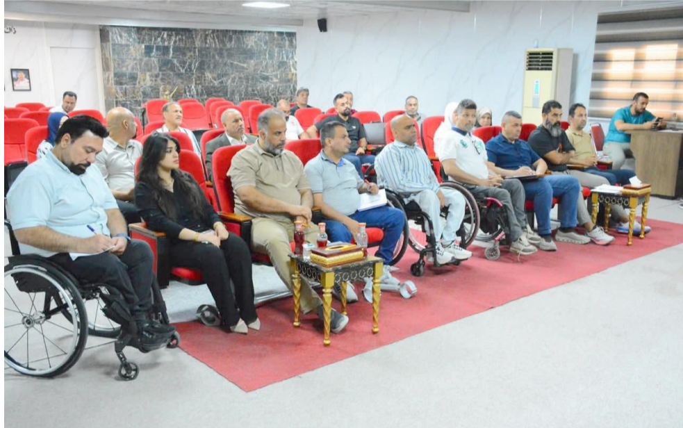
اجتماع : جانب من اجتماع اللجان المالية في الباراولمبية