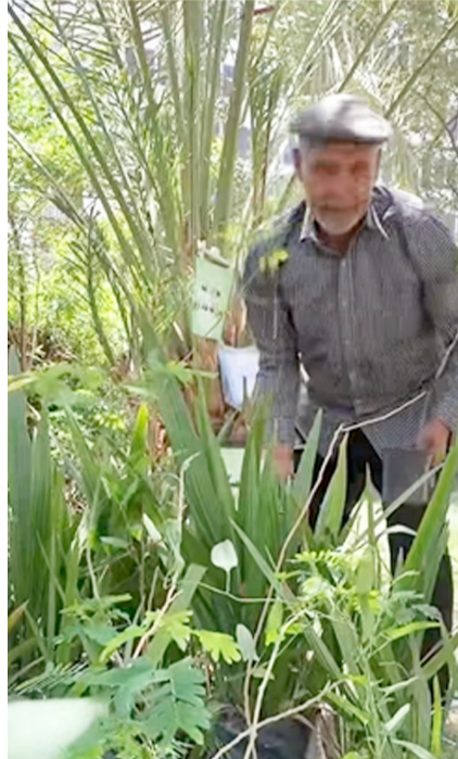
توزيع: الناشط البيئي الذي يادر بتوزيع الشتلات بمناسبة عيد الاضحى

بغداد - ابتهاج العربي وَزَع ناشط بيئي. عشرات الشتلات والأشجار ضمن بغداد. بمناسبة عيد الاضحى، في خطوة تهدف إلى نشر الوعي البيئي وتشجيع المواطنين على المساهمة في زيادة المساحات الخضراء. وضمن مبادرة بيئية لاقت ترحيباً واسعاً بين المواطنين.