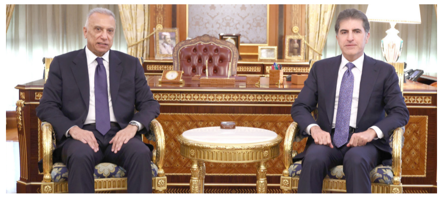
استقبال : رئيس إقليم كردستان نجيرفان البارزاني يستقبل في أربيل رئيس الوزراء الأسبق مصطفى الكاظمي

انقرة، دون إعطاء أي تفاصيل عن فعوى الزيارة). في سياق متصل، حذر زعيم حزب العمال الكردستاني عبد الله أوجلان، المحتجز في سجن انفرادي قرب إسطنبول، من أي تأخير إضافي في مسار حل النزاع مع السلطات التركية. وقال أوجلان في رسالة نشرها حزب المساواة