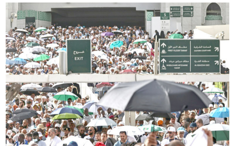
صلاة : حجاج يشارون المسجد الحرام بعد انقضاء الصلاة

اداء السعي بين جبلي الصفا والمروة عبر رمز مغلف ومجهز بانتظمة تكييف للتخفيف من وطأة الحر. ويتوجهون بعد ذلك إلى منى، استعداداً للركن الأعظم في الحج، أي العبادة الأهم، وهي اجتماع كل الحجاج على اختلاف مشاربهم في وقت واحد في جبل عرفات، حيث يتوجهون إلى الله بالدعاء. ويقام الحج هذا العام وسط درجات حرارة مرتفعة يتوقع أن تبدأ من 42 درجة مئوية على الأقل في معظم أيام الأسبوع. وتبلغ درجة الحرارة القصوى المتوقعة 45 مئوية، بحسب المركز الوطني للأرصاد في السعودية. وبرغم الحر الشديد وحالة الغموض المرتبطة بالحرب، بدأ الحجاج في مكة في غاية السعادة، فيما