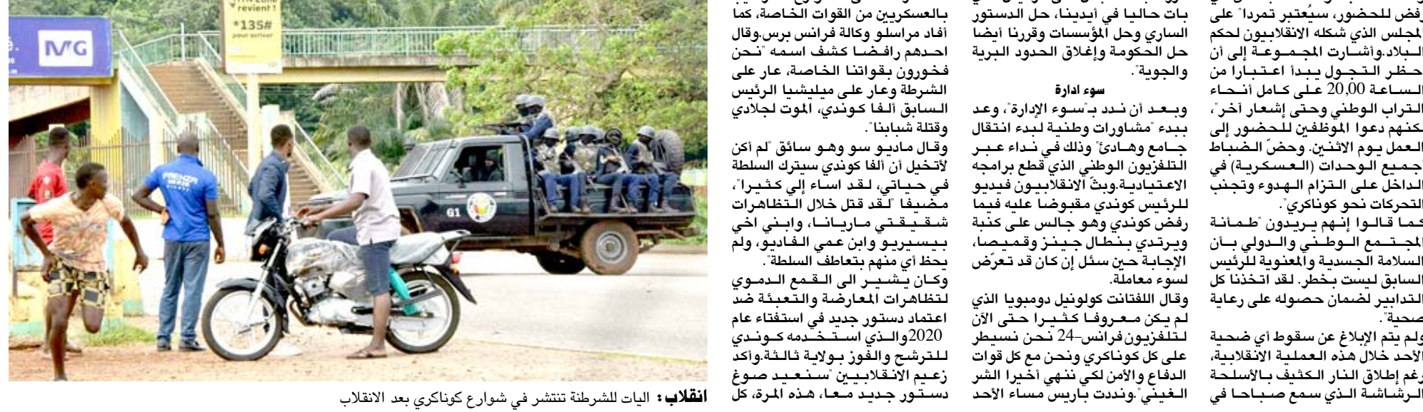
إنقلابيون يعلنون اعتقال رئيس غينيا والسيطرة على كوناكري