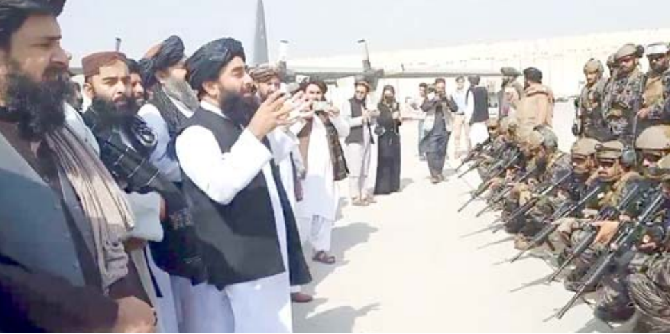
اندماج: مسؤول من طالبان يتحدث إلى القوات الأفغانية

منها في نيسان/أبريل عام 2018. وغرقت ليبيا في حالة من الفوضى بعد سقوط نظام معمر القذافي عام 2011 اتسمت في