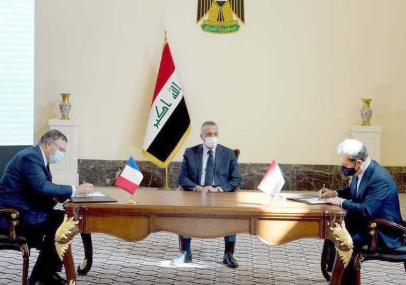
توقيع: رئيس الوزراء يرعى توقيع اتفاقية استثمار الغاز والطاقة مع توتال الفرنسية

بغداد - الزمان وقعت بغداد عقداً قيمته 27مليار دولار مع مجموعة توتال الفرنسية لاستثمار في الغاز والطاقة الشبكية مع انخفاض أسعار النفط الذي يمثل 90 بالمئة من عائدات البلاد). وقال وزير النفط العراقي، وينطوي على أربعة محاور ويهدف احد المشاريع إلى تنمية استثمار الطاقة الشمسية المتوافرة بشدة في هذا البلاد التي يغلب على مناخها الطابع الصحراوي). في تطور، أعلنت وزارة الكهرباء، عودة تجهيز الغاز الإيراني للمناطق الوسطى بواقع 20مليون متر مكعب يوميا، وقال الناطق الرسمي باسم الوزارة