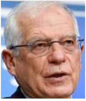
بغداد - الزمان

افاد وزير الخارجية فؤاد حسين، بان العراق ليس دعماً قوياً من الاتحاد الاوربي لإجراء الانتخابات المبكرة وقال حسين في مؤتمر مشترك مع ممثل الاتحاد للشؤون الخارجية والسياسة الاقليمية جوزيب بوريل الذي وصل بغداد امس ان اللقاء تطرق للملف الاقتصادي والسياسي والامنية بين العراق والاتحاد الاوربي، وأضاف ان موضوع الانتخابات المقبلة كان محوراً مهماً من المناقشات الثنائية والتعاون مستمر مع الاتحاد في شتى المجالات، وأشار حسين الى ان للممثل الاوربي برنامح مكثف وسيلتقي الزمانات الثلاث وله زيارة الى اربيل للقاء قادة اقليم كردستان، مؤكداً لقد لمسنا دعماً قوياً من الاتحاد لاجراء الانتخابات المقبلة في موعدنا، من جانبها أكد بوريل ان العراق القوي سيكون له تأثير كبير في المنطقة، وقد بحثنا ملفات الهجرة والامن ولدينا شركات كبيرة في مجال من العراق، وانه لا يوجد اي مكان للارهاب في البلاد، وحث بوريل على اجراء الانتخابات عادلة والاتحاد سيقوم بنشر مراقبين خلال يوم الاقتراع، وأضاف (قديماً أكثر من مليار دولار لدعم العراق خلال الاعوام الماضية)، من متعهداً بالاستمرار في العمل من اجل دعم السلطات العراقية لبناء بلد مستقر، وقال (ترحب بجهود العراق بالمنطقة التي الهاف لتعزير الجوار والحلول الالاقيمية ونعتقد بالاستمرار في دعمه) ومن المقرر ان يلتقي المسؤولين الاوربي الممثلين الخاصة للامين العام للأمم المتحدة في العراق، كما سيعقد بوريل اجتماعات مع ممثلين عن المجتمع المدني والقطاع الثقافي بالعراق، ولقاء كبار المسؤولين في اقليم كردستان، في غضون ذلك، أكد رئيس الجمهورية برهم صالح، مجموعة من السفراء الجدد، ان علاقات العراق