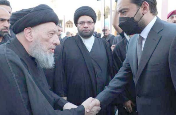
تعاذ: رئيس البرلمان يقدم التعازي لمرجع النجف بوفاء الحكيم

بغداد - سعدون الجابري شارك رئيس مجلس النواب محمد الجلبوسي بمجلس عزاء المرجع محمد سعيد الحكيم الذي توفي الجمعة الماضية اثر سكتة قلبية مفاجئة. وقال بيان مقتضب ان (الجلبوسي وصل المحافظة لتقديم التعازي بوفاء الحكيم). وقدم الاسين العام لحركة الوفاق الكاظمي وعدد من المرجع والشخصيات البارزة قد حضروا مجلس عزاء المرجع الحكيم في النجف، ووجه الكاظمي خلال زيارته الى المحافظة بمنح قدم سنة شهر للضيافة وسنة للمنتسبين، كما عزى كبار العلماء في البحرين برحيل الحكيم، وجاء في بيان (ننعي رحيل العالم الرياني والفقيه الجليل الحكيم، كما نعزي بهذا المصاب مراجع الدين العظيم وعموم المؤمنين والحوزات العلمية في النجف و قم وفي سائر بلاد اسلام، ونخص بالبعزاء والمواساة أسرة ال الحكيم).