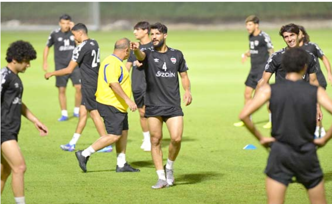
تدريب : جانب من تدريبات أسود الرافدين في الدوحة