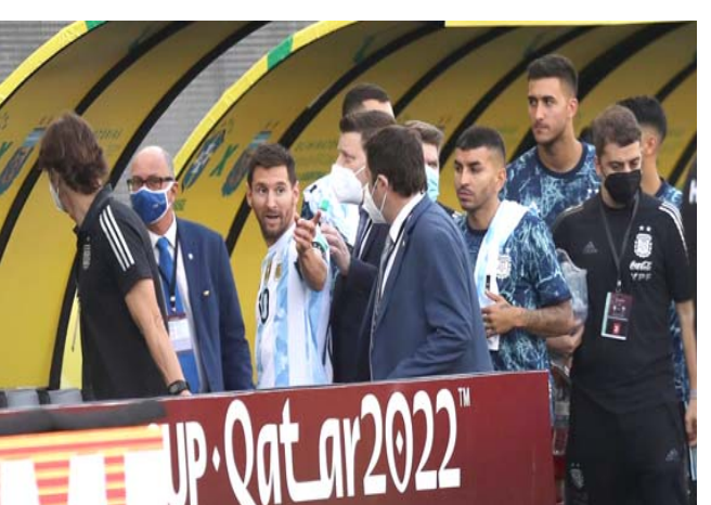
لحظة انسحاب الأرجنتين من المباراة

بغداد- الزمان بواصل المنتخب الوطني لكرة اليد، معسكره التدريبي بالمقام حالياً في محافظة السليمانية استعداداً لتصفيات آسيا المؤهلة الى كأس العالم والتي ستقام مطلع العام المقبل في المملكة العربية السعودية. وقال رئيس الاتحاد العراقي لكرة اليد محمد الأعرجي، في تصريح صحفي إن المعسكر سيستمر لمدة عشرة ايام تحضيراً للتصفيات الآسيوية، لافتاً الى ان هناك نية لإقامة معسكر خارجي في أحد