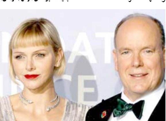
بقية الخبر على موقع (الزمان)

وصدر في وقت لاحق بيان عن ديوان أمير موناكو جاء فيه أن صاحبة السمو تخضع لمتابعة من قبل فريقها الطبي الذي أكد أن وضعها مطمئن . وكانت الأميرة شارلين خضعت الشهر الماضي لعملية جراحية لم ترشح عنها تفاصيل كثيرة. وأنضم إليها الأمير البير وطفلهما خلال فترة النقاهة. وقالت مديرة المؤسسة شانتيل ويتستوك إن الأطباء ما زالوا يحاولون تحديد ما حصل بالضبط ، مشيرة إلى أن هذه الوعكة حدثت في وقت كانت الأميرة قيد التعافي . وارتفت لعد عانت خيرا . تزوجت الساحة السابقة شارلين لينبت ويتستوك المولودة سنة 1978 أمير موناكو البير الثاني في 2011 . وكشانتل إحدى أولى 2011 الإطلاقات العامة لهما في دورة الألعاب الأولمبية الشتوية في تورينو سنة 2006 . وابتهاجا هو وريث عرش سلالته غريمالدي التي يعود أصلها إلى أكثر من 700 سنة . وكانت وسائل الإعلام المتابعة لشؤون المشاهير قد أذارت مجددا في الفترة الأخيرة تكهيات بشأن طلاق الزوجين أو انفصالهما إثر غياب المطول للأميرة عن موناكو .