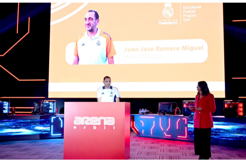
إفتتاح: جانب من حفل افتتاح أكاديمية ريال مدريد في أربيل

الوطنية، أسوة بالمدل المتطورة في هذا المجال، وهذا الملعب سيساعد اللاعبين العراقيين على خوض أجواء البطولات الدولية بثقة أكبر، بعدما أصبح لديهم مكان احترافي للتدريب وخوض التجارب