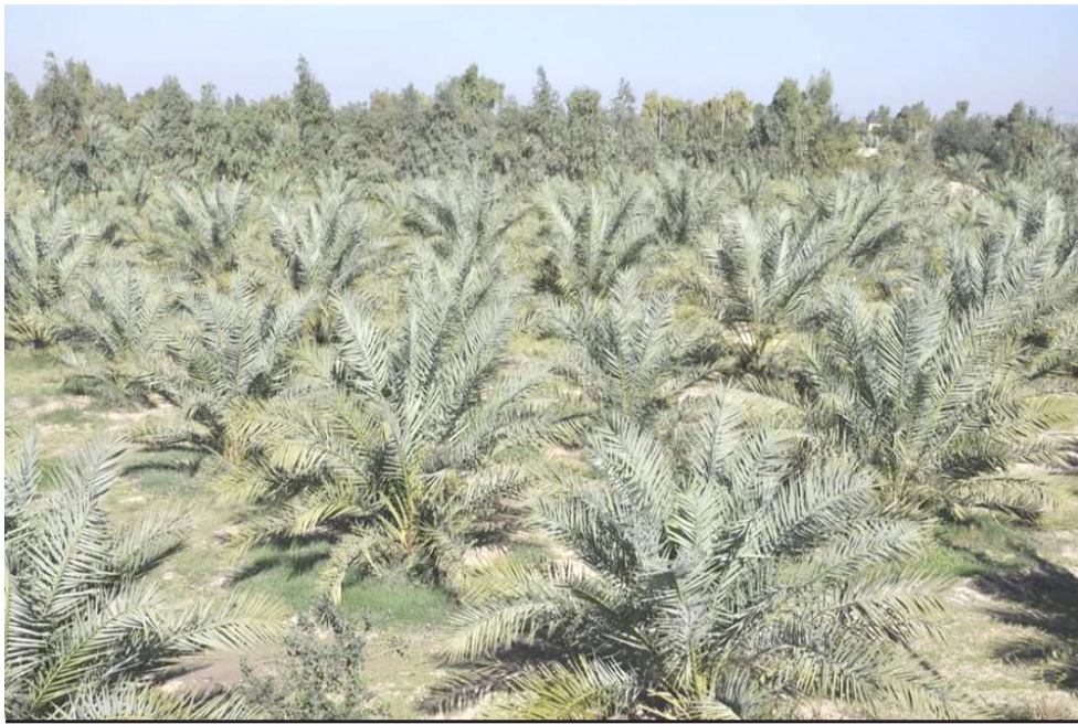
غابة : اشجار في طور النمو في غابة النجف