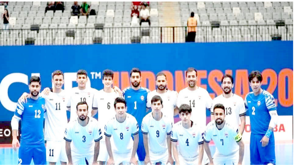
كرة: منتخب كرة الصالات بكرة القدم

وجاء العراق في صدارة ترتيب المنتخبات العربية على الصعيد القاري وحل ثانياً بعد المغرب في تسلسل المنتخبات العربية. التقدم الكبير جاء بعد الأداء المميز الذي قدمه منتخبنا الوطني في نهائيات كأس آسيا لكرة الصالات، التي أقيمت في العاصمة الإندونيسية جاكارتا، وتمكن خلالها من بلوغ الدور نصف النهائي ومنافسة كبار القارة ويُعد هذا الإنجاز خطوة مهمة تعكس التطور الواضح الذي