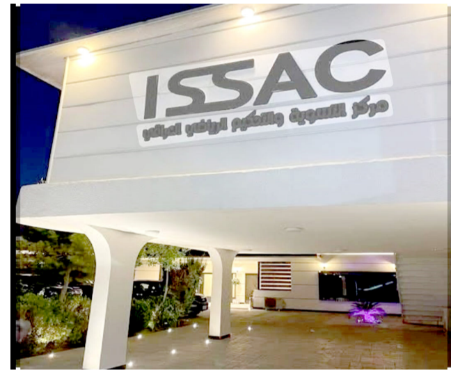
تحكيم: مركز التسوية والتحكيم الرياضي

النزاعات الكروية تغادر أسوار الملاعب وقاعات الاتحادات، لتجد طريقها نحو مراكز الشرطة، في