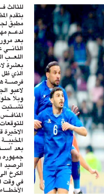
خسارة: فريق القوة الجوية يتعرض لخسارة قاسية أمام فريق الكرمة بثلاثية

الثالث في الدقيقة 45 وينتهي الشوط متشعلا و مستترا للأخير ويجد الضيف صمدت ملطيق لجمهور الجوية الذي حضر بكافة لدعم مهمة الفريق التي زادت صعوبة بعد مرور ثلاث دقائق على بداية الشوط الثاني عندما طرد امينو عشر لتعد اللعب الضيف ليكمل الفريق المباراة بعشرة لاعبين ما سهل المهمة أكثر للكرمة الذي ظل الأقوى والأخطر واهر أكثر من فرصة هدف لزيادة الغلة بينما استمر لاعبو الجوية تقديم الأداء بجهد شديد وبلا حلول وخضورة واكتفى الفريق في تشبث الكرات للحد من ضغط وخضورة المنافس الذي كان في الموعد وخلافا للوقعات بعد تراجع واضح في الجولات الأخيرة قبل أن يجد من سلسلة النتائج الخيبة و بداوي الجراح بالفوز الثمن بعد استغلال الفرصة بالكامل ويصالح جمهوره وسط فرحة كبيرة بالفوز ورفع الرصيد إلى 57 وتوسع الفارق مؤقلاً عن الكرخ إلى خمس نقاط